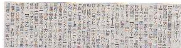
読売新聞、中日新聞、スポーツ報知、千葉日報、四国新聞 他