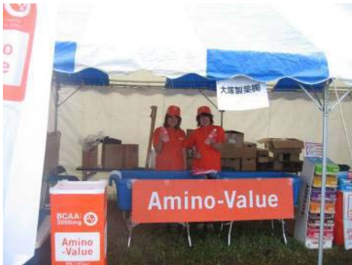
給水ポイント 大塚製薬