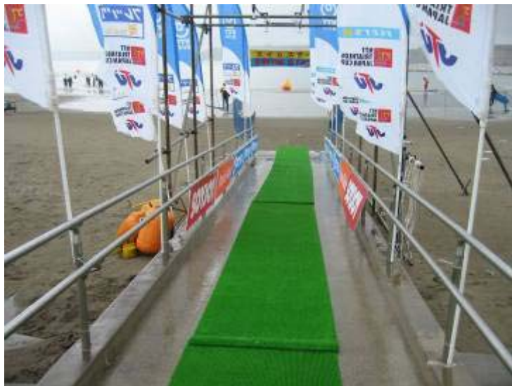
スイムフィニッシュ (難波温泉海岸)