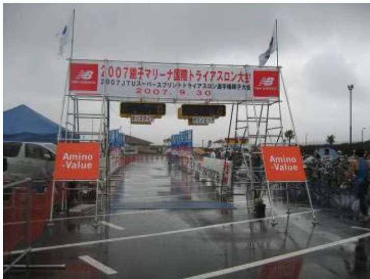
アドバナー NTT東日本