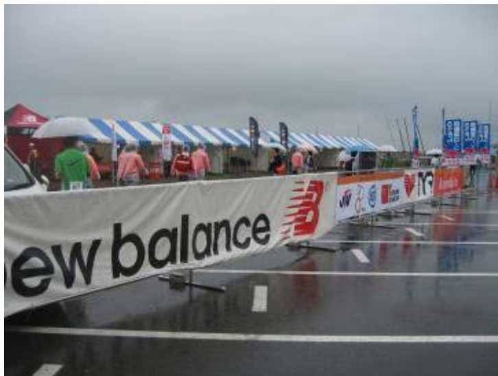
のぼり NTT東日本・NTT西日本