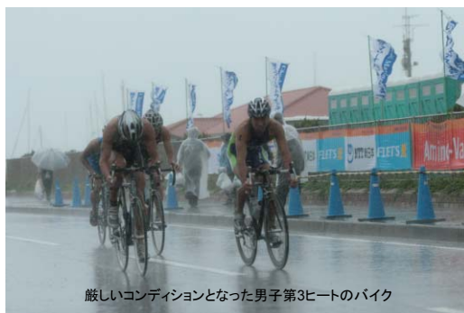
厳しいコンディションとなった男子第3ヒートのバイク