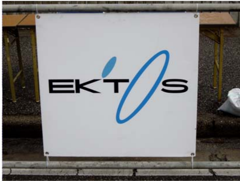
エクトスアドボード(フィニッシュゲート前)