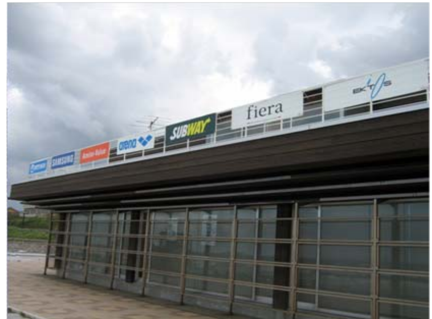
アドボード: スイムエリア