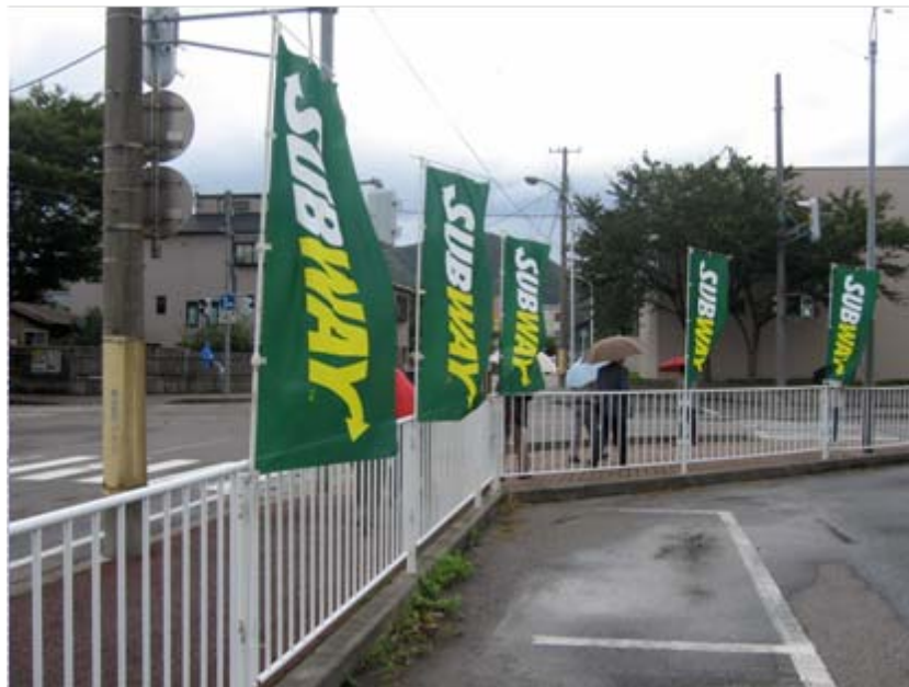
日本サブウェイのぼり