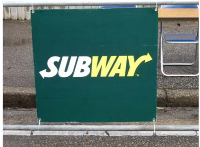
日本サブウェイアドボード(フィニッシュゲート前)