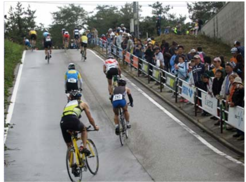
1kmのランの後、バイクへ。コースはエリートと同様、笹川流れを40km走る