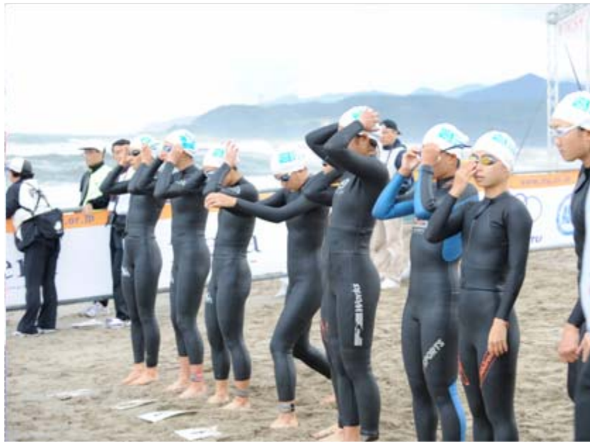
1 エリート女子は17名が出場(DNS3名)