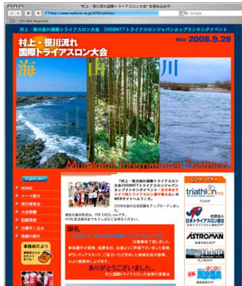
村上大会公式WEBサイト

http://www.jtu.or.jp/race/japancup/2008/murakami/index.html