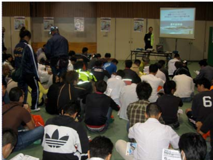
競技説明会(国際部門出場選手)