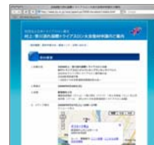
メディア取材案内

http://www.jtu.or.jp/news/08MurakamiPhG/index.htm