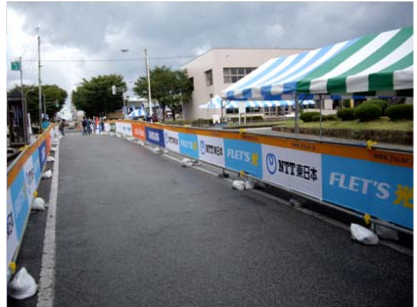
アドバナー:フィニッシュゲート前