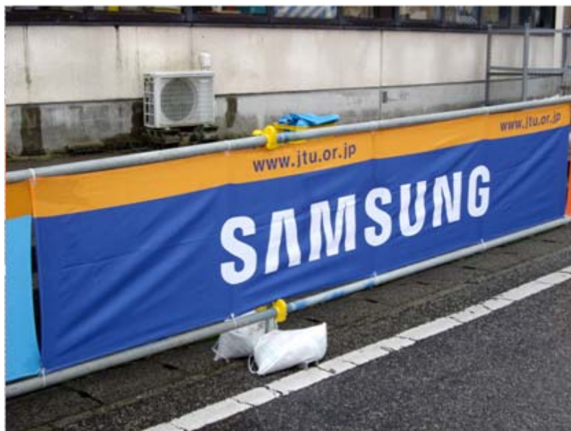
アドバナー:日本サムスン