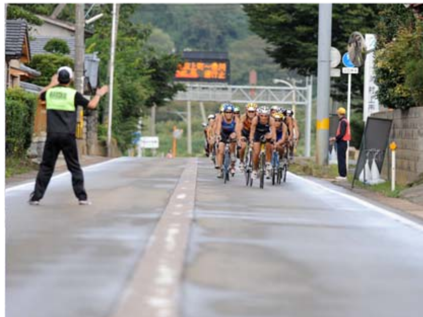
8 バイク終盤、第2集団が追いつき、合計17名の大集団となった