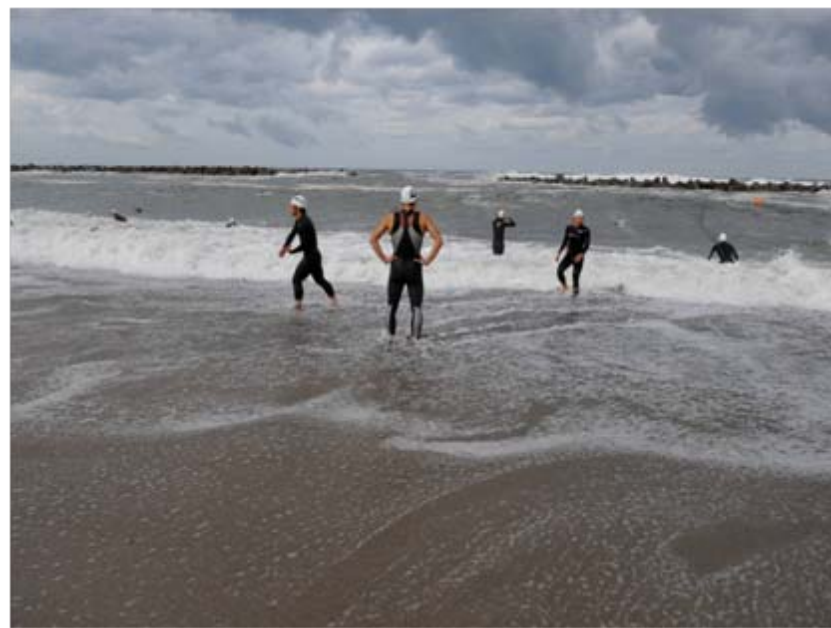
スイムウォーミングアップ