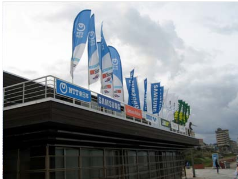
のぼり: スイム会場