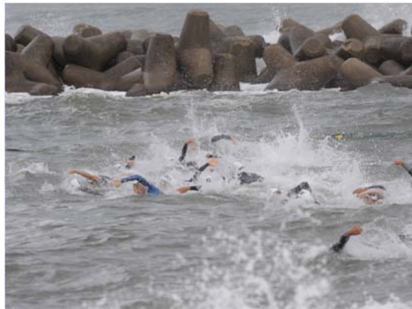
2 波が高いためスイム距離は450m短縮の1.05km(2周回)に変更された