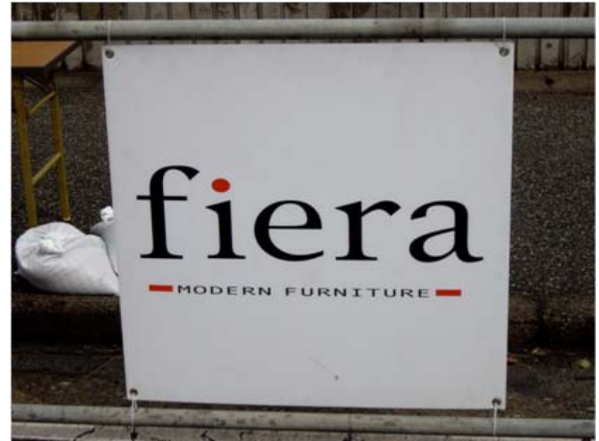
フィエラアドボード(フィニッシュゲート前)