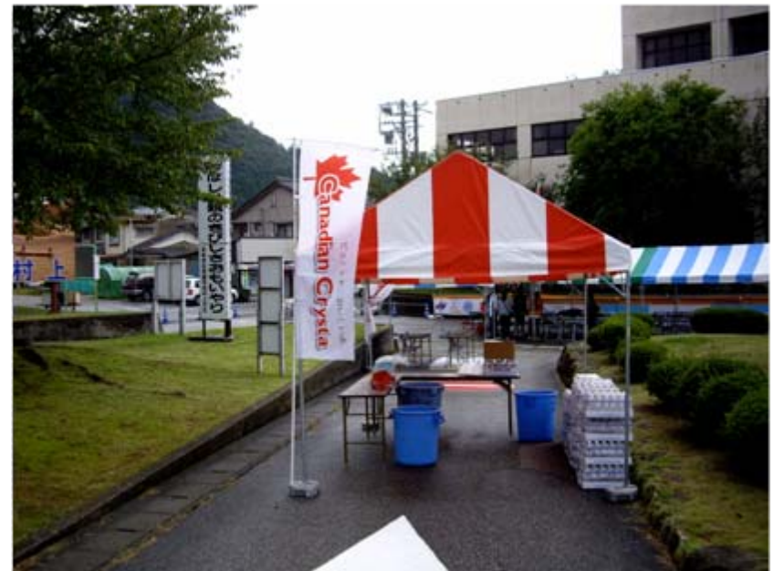
給水所(フィニッシュゲート横)