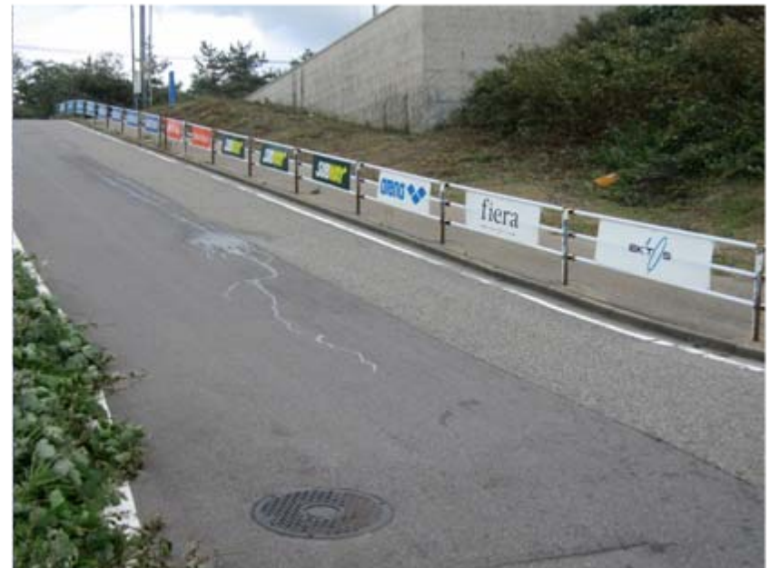
アドボード: コース沿道(瀬波温泉海岸)