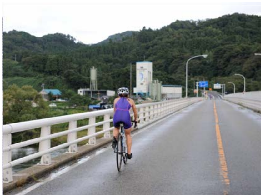
8 笹川流れのバイクコース