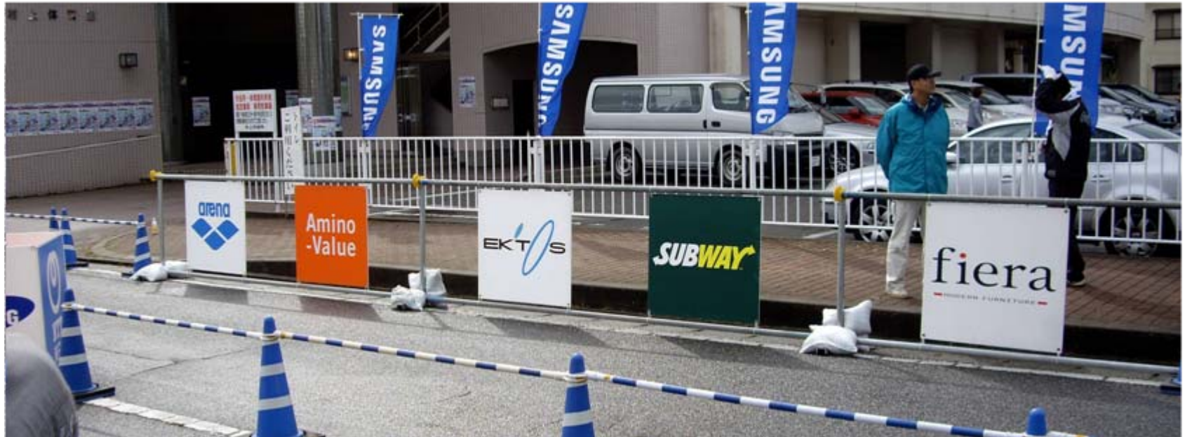
アドボード(フィニッシュゲート前)