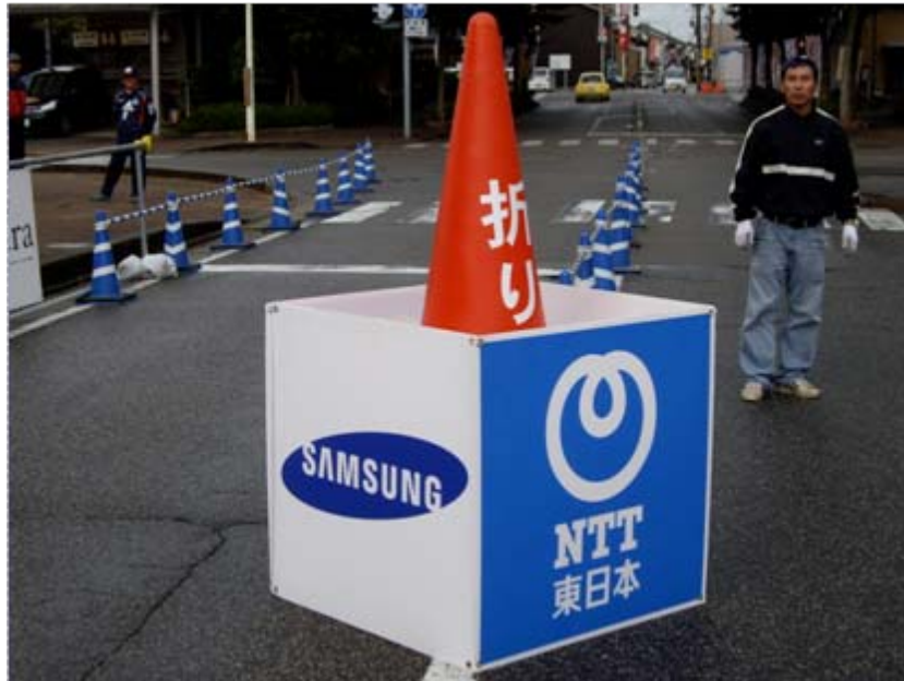
NTT東日本・日本サムスンアドボード(ラン折り返し地点)