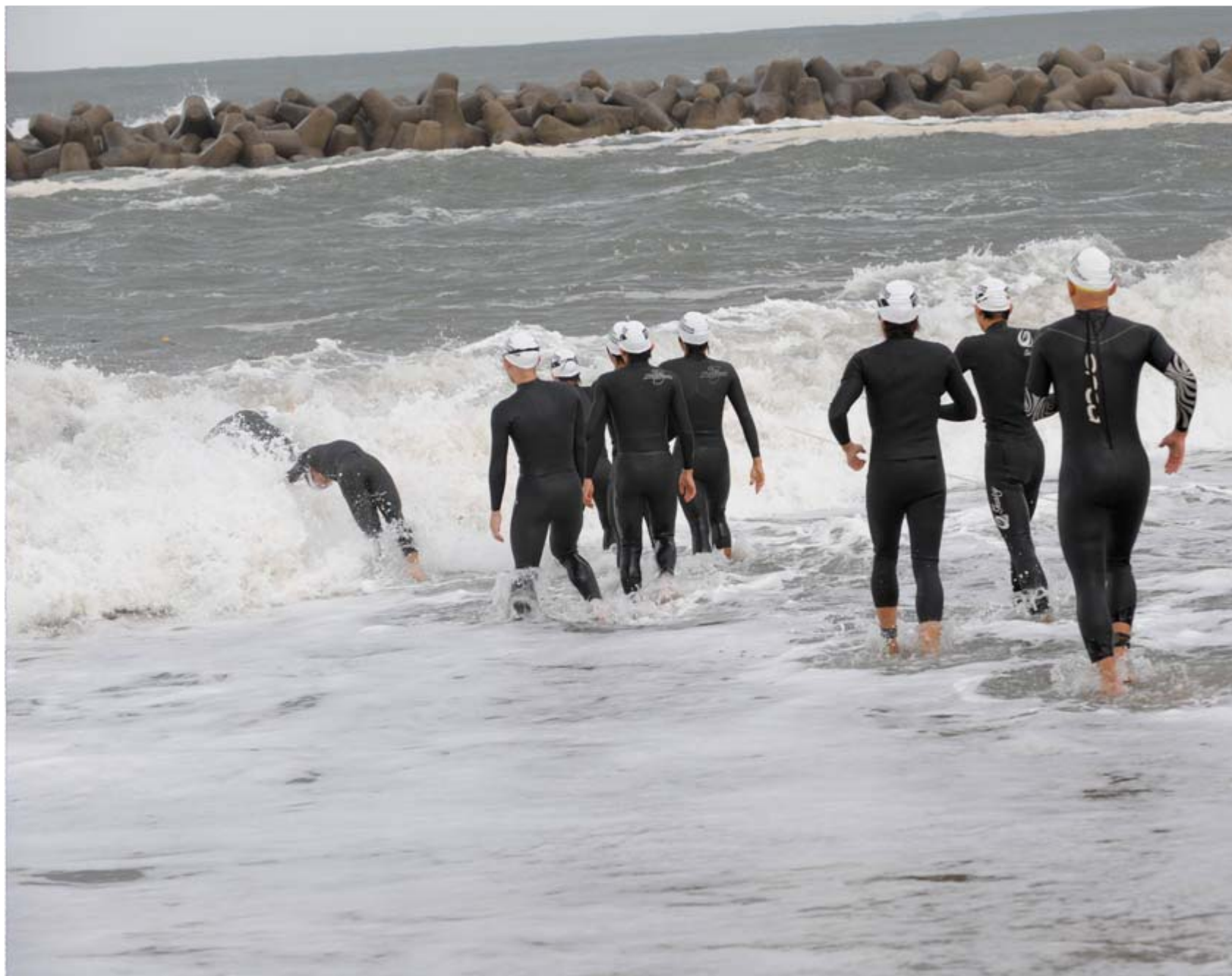
前日からの荒天で波が高くエリートのスイム距離は1.5kmから1.05kmに短縮され、ウェットスーツ着用が義務に。国際部門はデュアスロンへ変更となった。