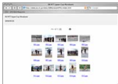
村上大会フォトギャラリー

http://www.jtu.or.jp/news/08MurakamiPhG/index.htm