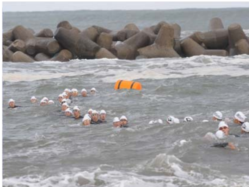
1 エリート男子は39名が出場(DNS 1名)