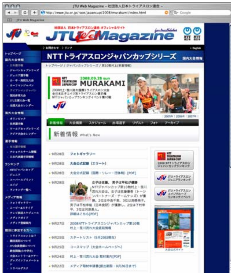
JTU公式サイト内 村上大会情報ページ

http://www.jtu.or.jp/race/japancup/2008/murakami/index.html