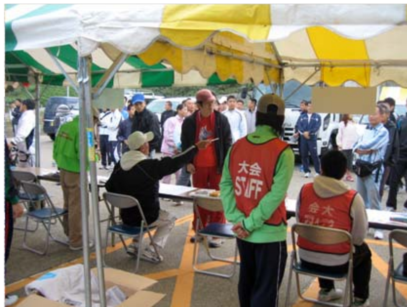
受付会場風景(瀬波温泉海岸)