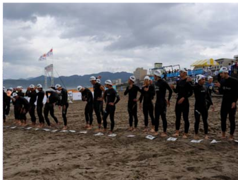
スタートセレモニー