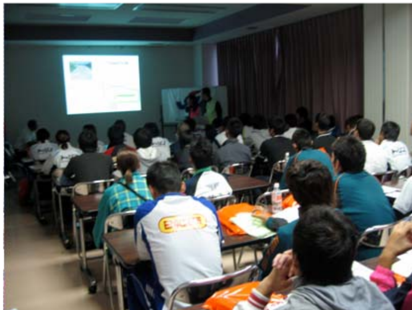
競技説明会(エリート部門出場選手)