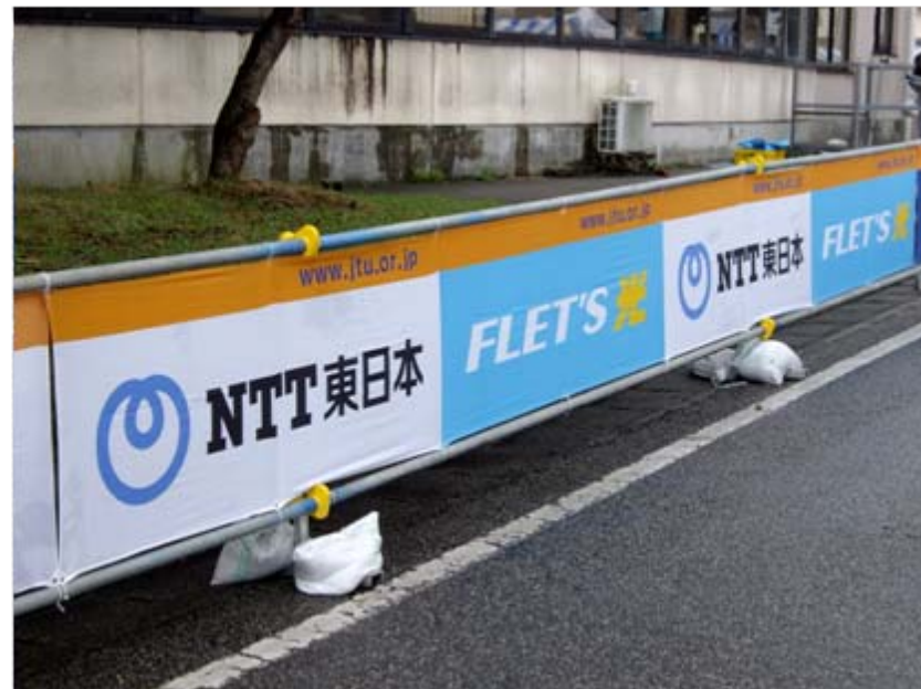
アドバナー:NTT東日本