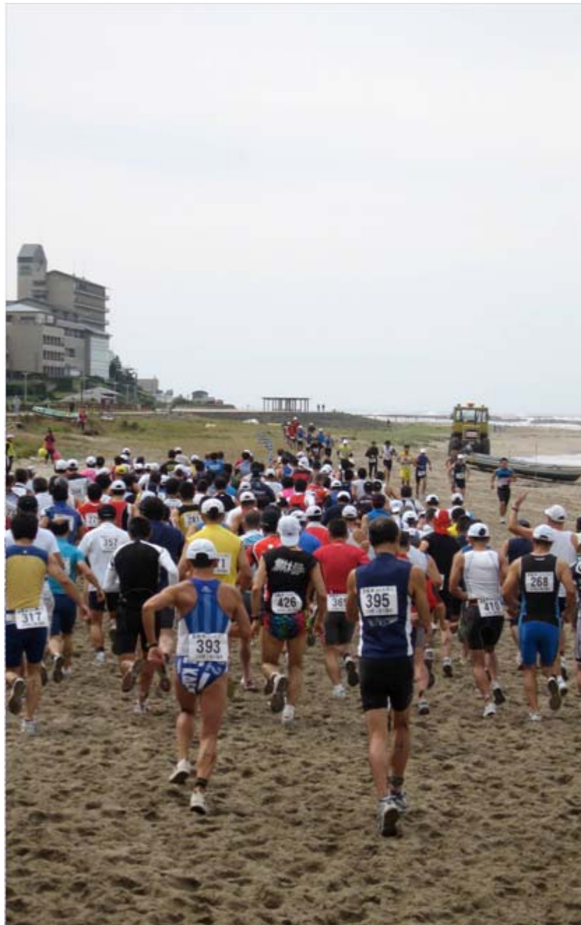
荒天により、国際部門は第1ランは1kmのデュアスロンに変更となった