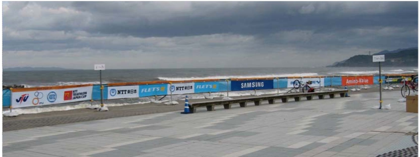
アドバナー:スイム会場