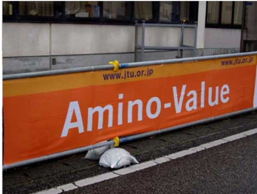
アドバナー: 大塚製薬 (Amino-Value)