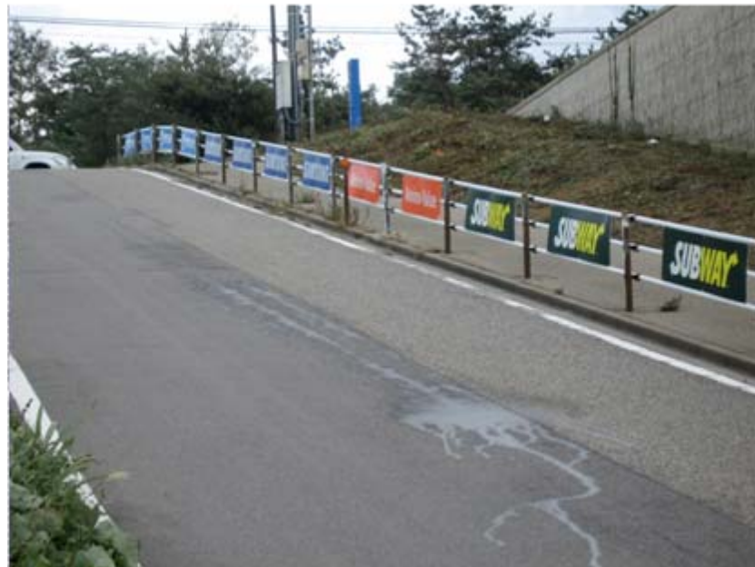
アドボード: コース沿道(瀬波温泉海岸)