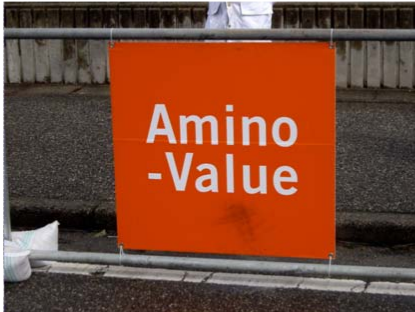
大塚製薬Amino-Valueアドボード(フィニッシュゲート前)