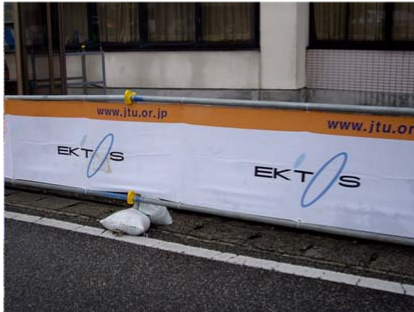
アドバナー: エクトス