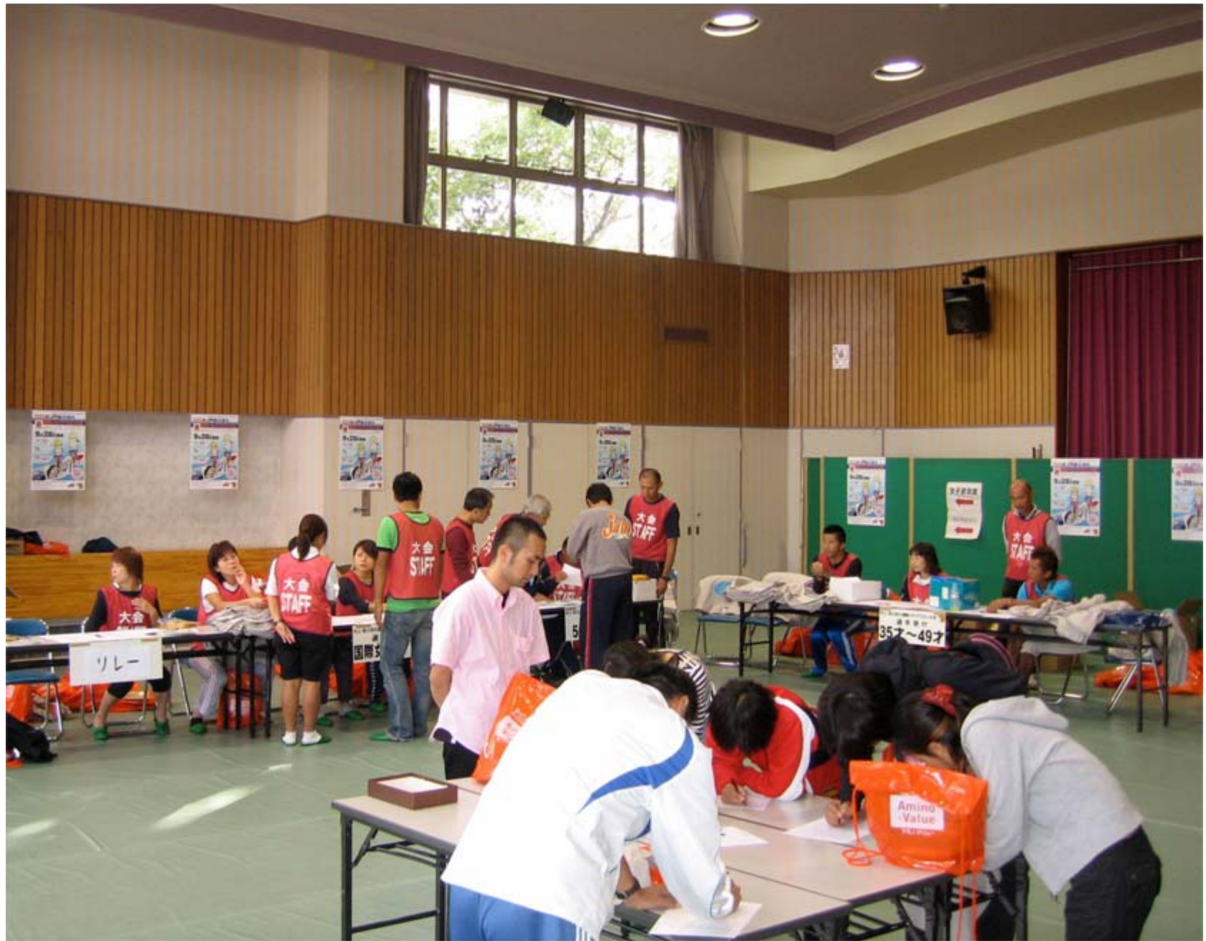
選手・メディア受付会場(クリエート村上)