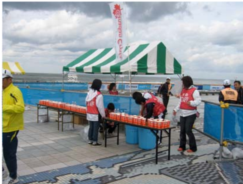
給水所(スイム・トランジションエリア)