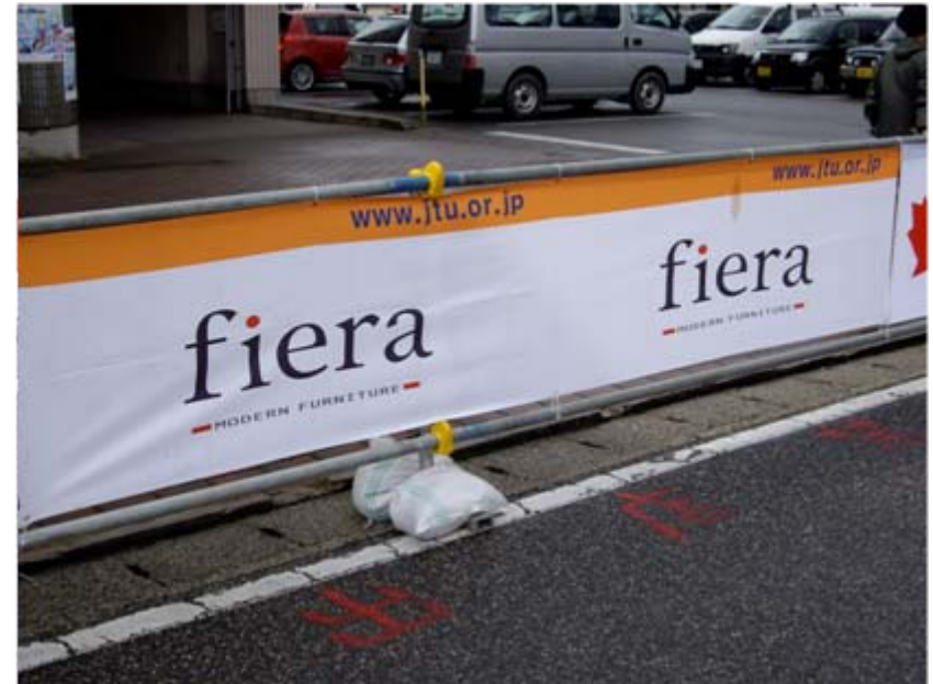
アドバナー: フィエラ