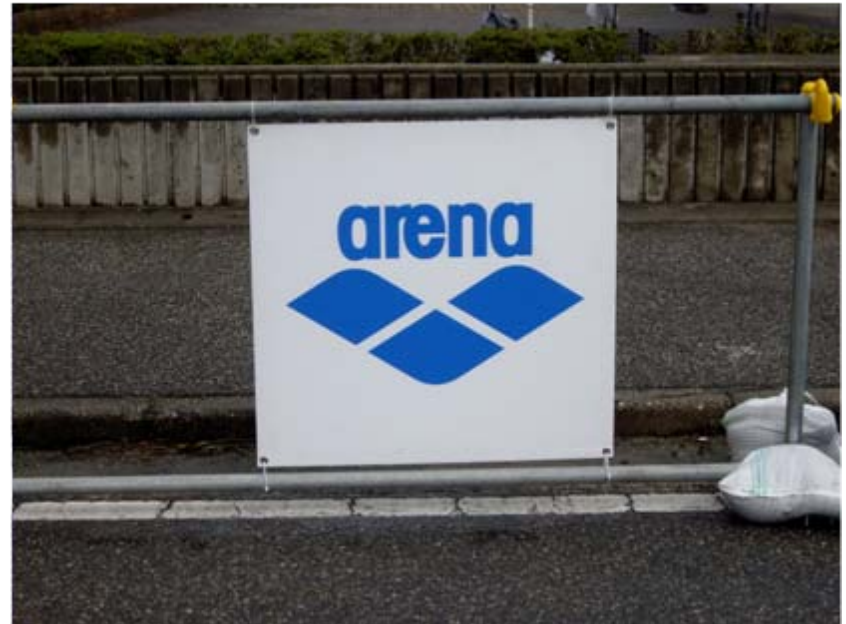
アリーナアドボード(フィニッシュゲート前)