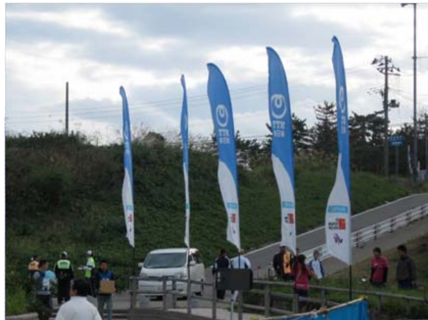
NTT東日本のぼり: スイム会場 (トランジションエリア付近)