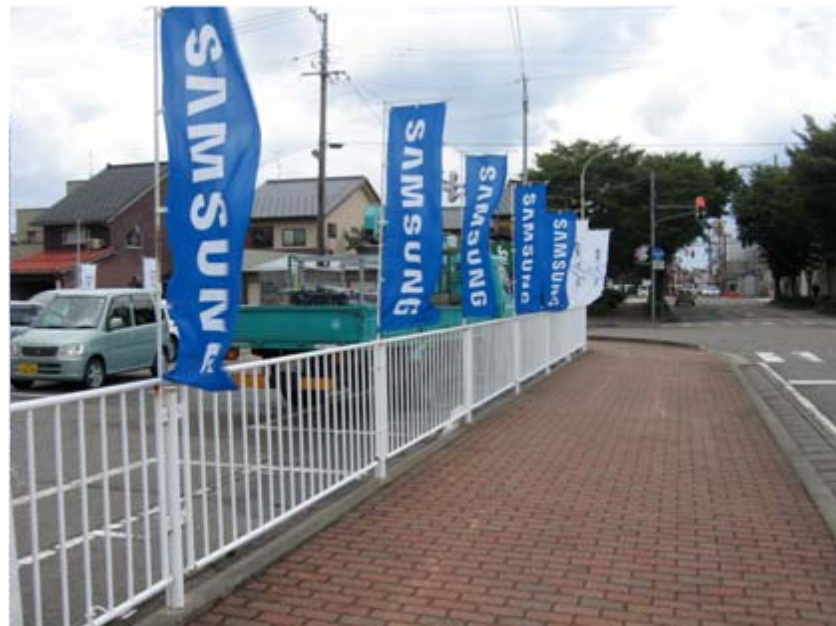
日本サムスン・エクトスのぼり