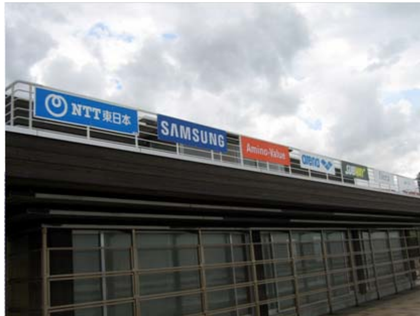
アドボード: スイムエリア