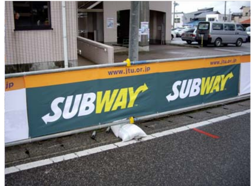
アドバナー: 日本サブウェイ