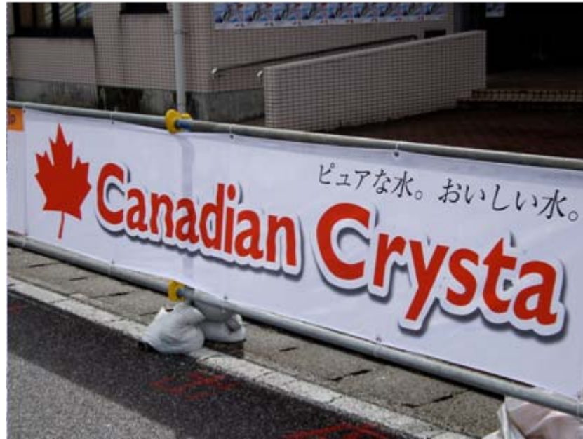
アドバナー:カナディアンクリスタ