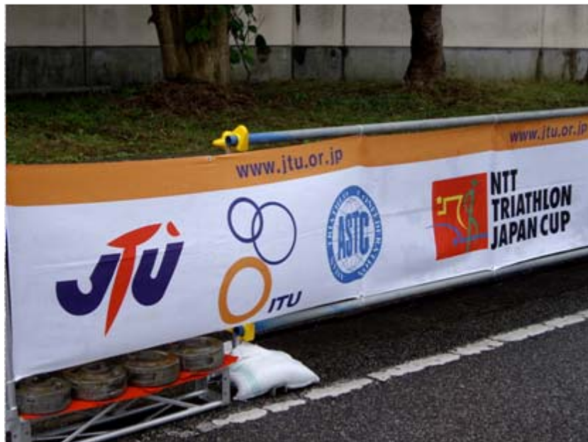
アドバナー:NTTトライアスロンジャパンカップ