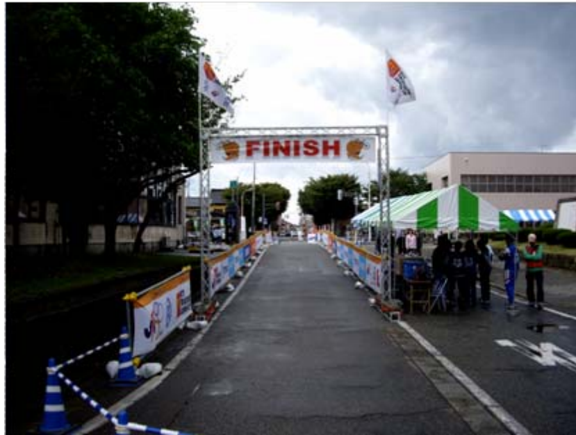
フィニッシュゲート