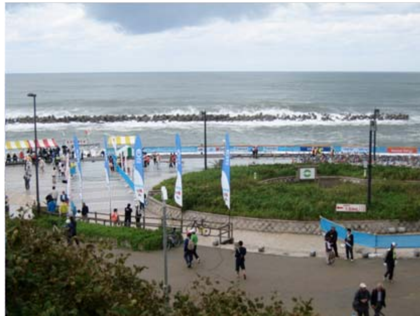
スイム・トランジションエリア