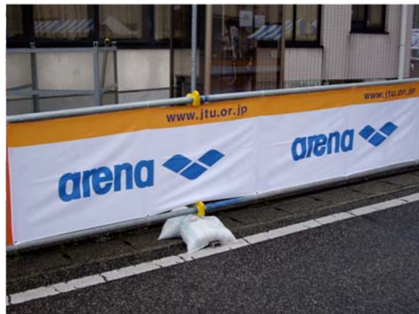
アドバナー:アリーナ