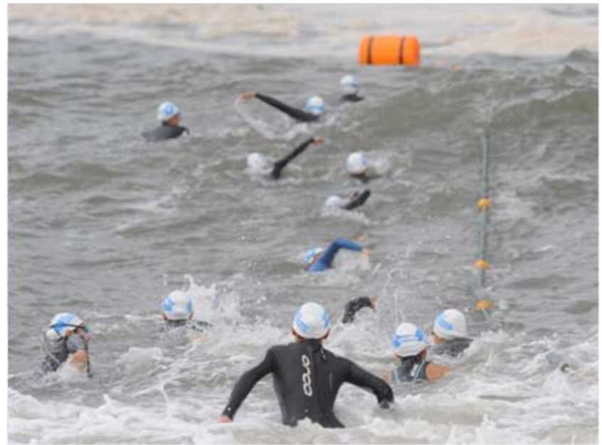
2 男子の5分後にスタート。写真はスタート地点へ移動する様子