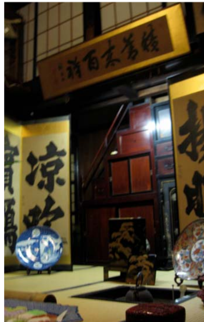
会場の村上市では、昔から各家に伝わる伝統の屏風や民具の数々を、各町屋(60軒以上)で披露する「屏風まつり」が開催されていた(9/10~10/13)