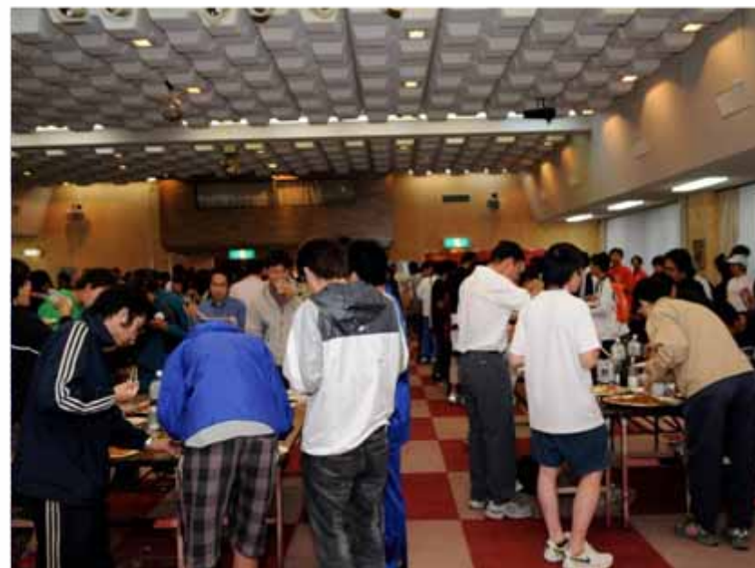
カーボパーティー(18:30~/勤労福祉センター)