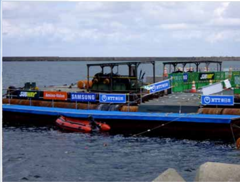
スイムスタートエリア