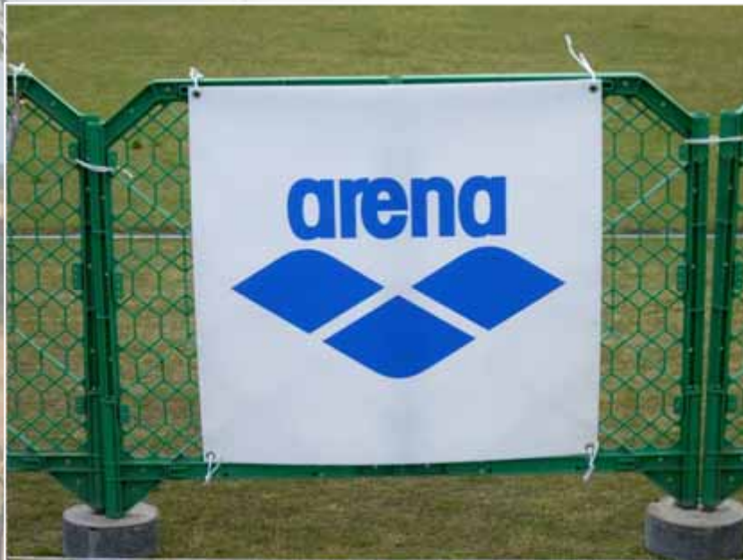
アドボード(940×985 / トランジションエリア付近掲出) : アリーナ(協賛)