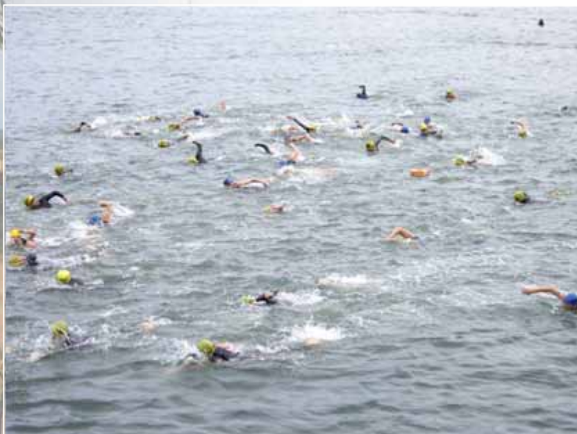
スイムの距離は1.5km、750mを2周する