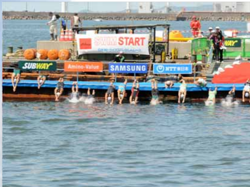
13時50分、最終ヒートスタート