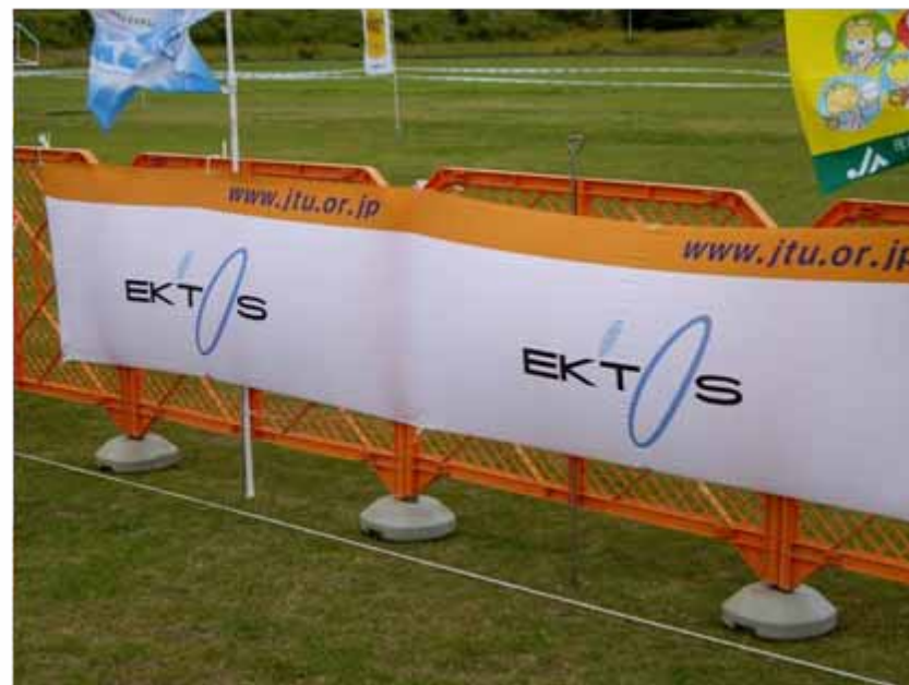
アドバナー(フィニッシュエリア付近掲出) :エクトス(協賛)