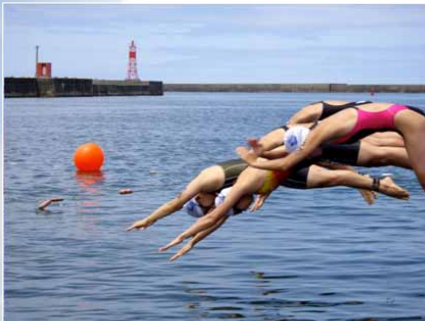
11時20分 女子第1ヒートスタート