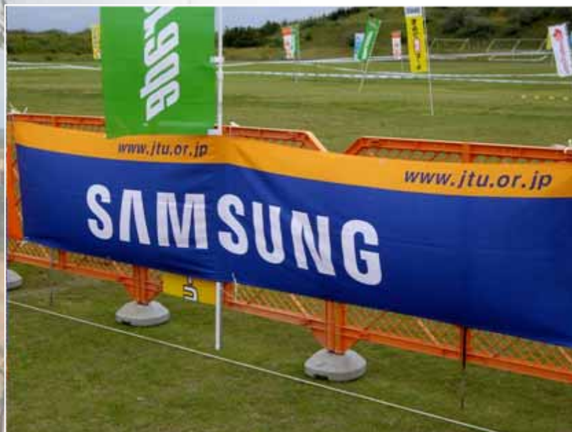
アドバナー(フィニッシュエリア付近掲出) :サムスン(協賛)