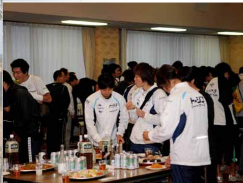
カーボパーティー(18:30~/勤労福祉センター)