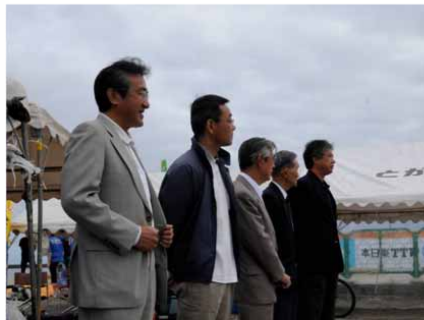
開会式(07:55～ / スイム会場)