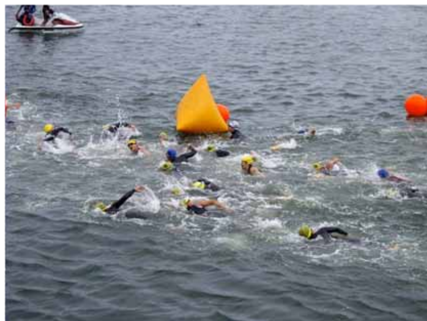
最初の折り返し地点