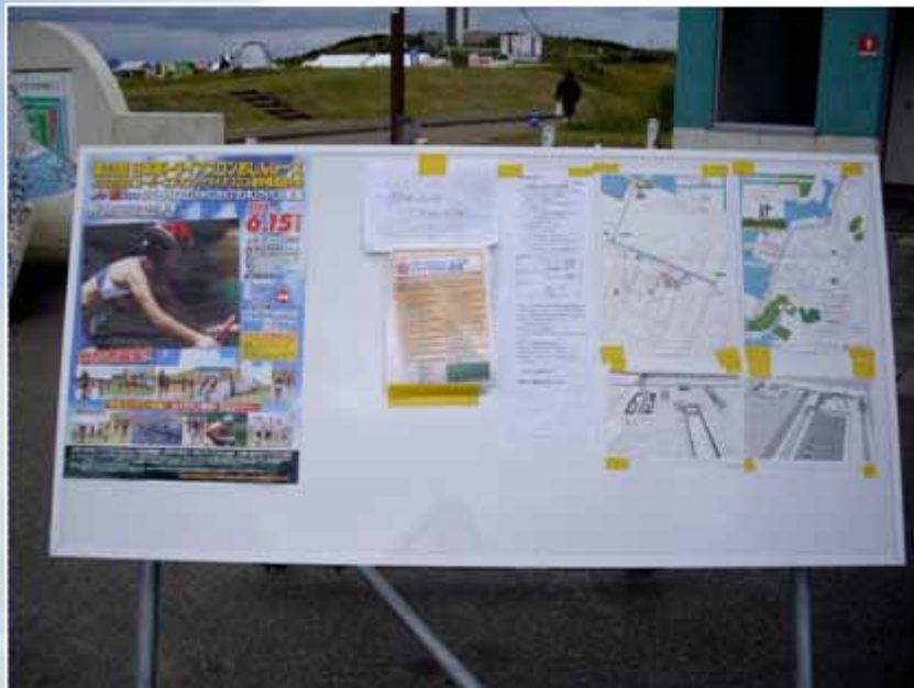
会場内案内ボード