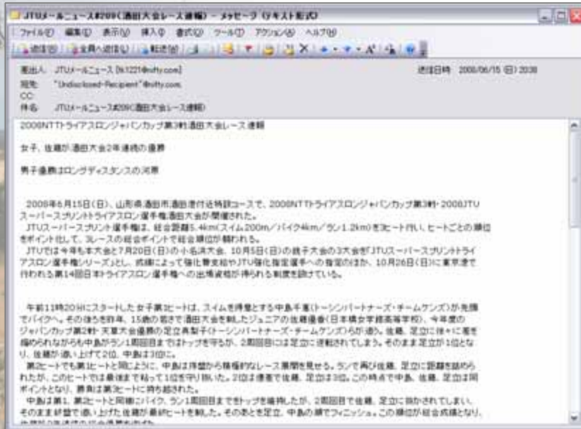
6月15日(日)配信「酒田大会レース速報」