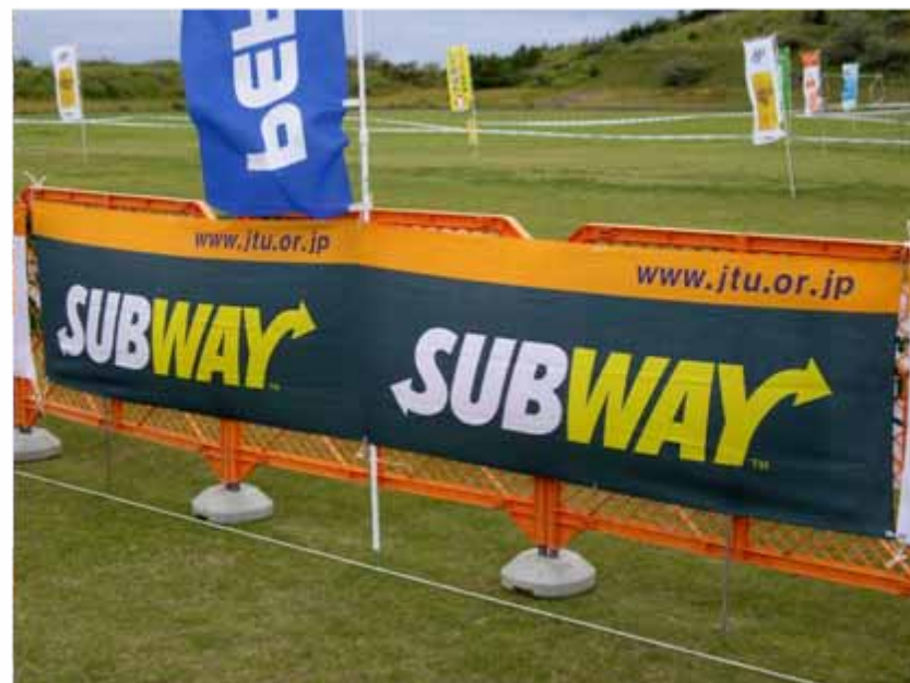
アドバナー(フィニッシュエリア付近掲出) :SUBWAY(協賛)