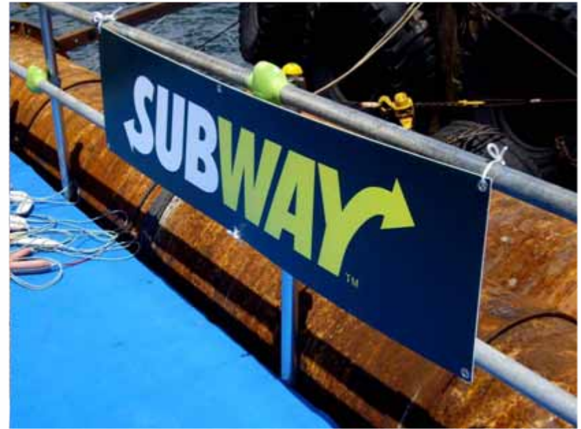
アドボード(スイムスタートエリア掲出) :SUBWAY(協賛)