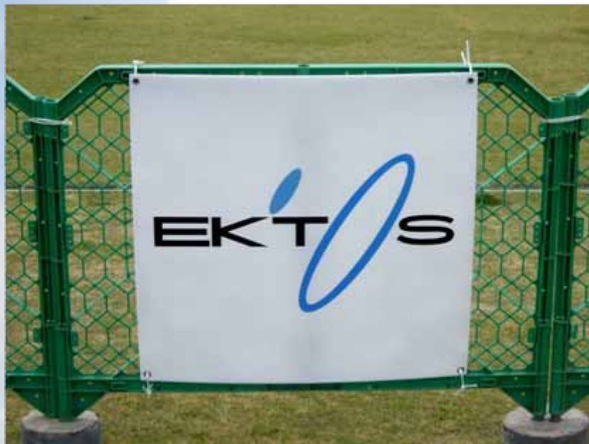
アドボード(940×985 / トランジションエリア付近掲出) : エクトス(協賛)