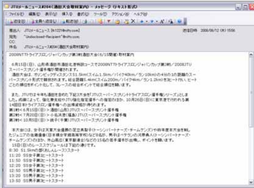
6月12日(木)配信「酒田大会取材案内」