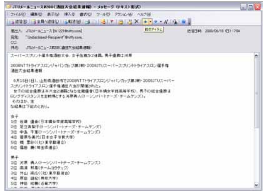
6月15日(日)配信「酒田大会結果速報」