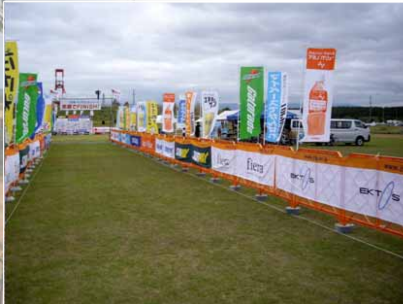
アドバナー(フィニッシュエリア付近掲出) :全体