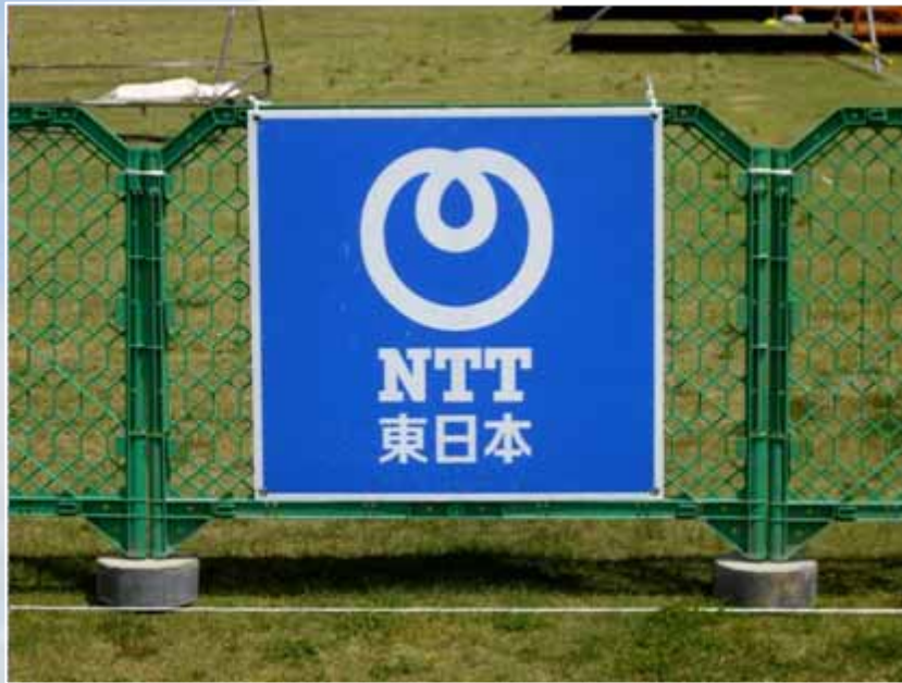
アドボード(940×985 / トランジションエリア付近掲出) : NTT東日本(協賛)