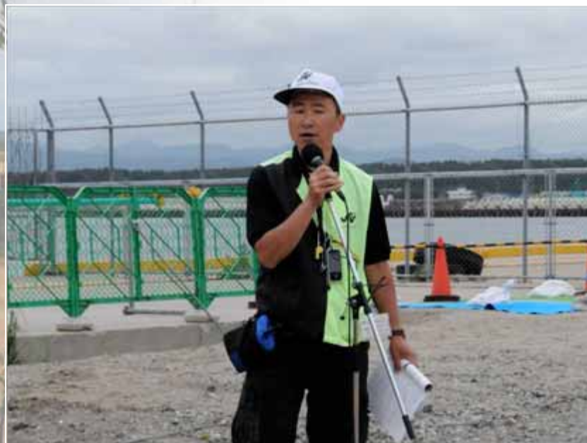
競技説明会(7:45～ / スイム会場)