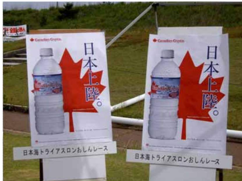
カナディアンクリスタ紹介POP