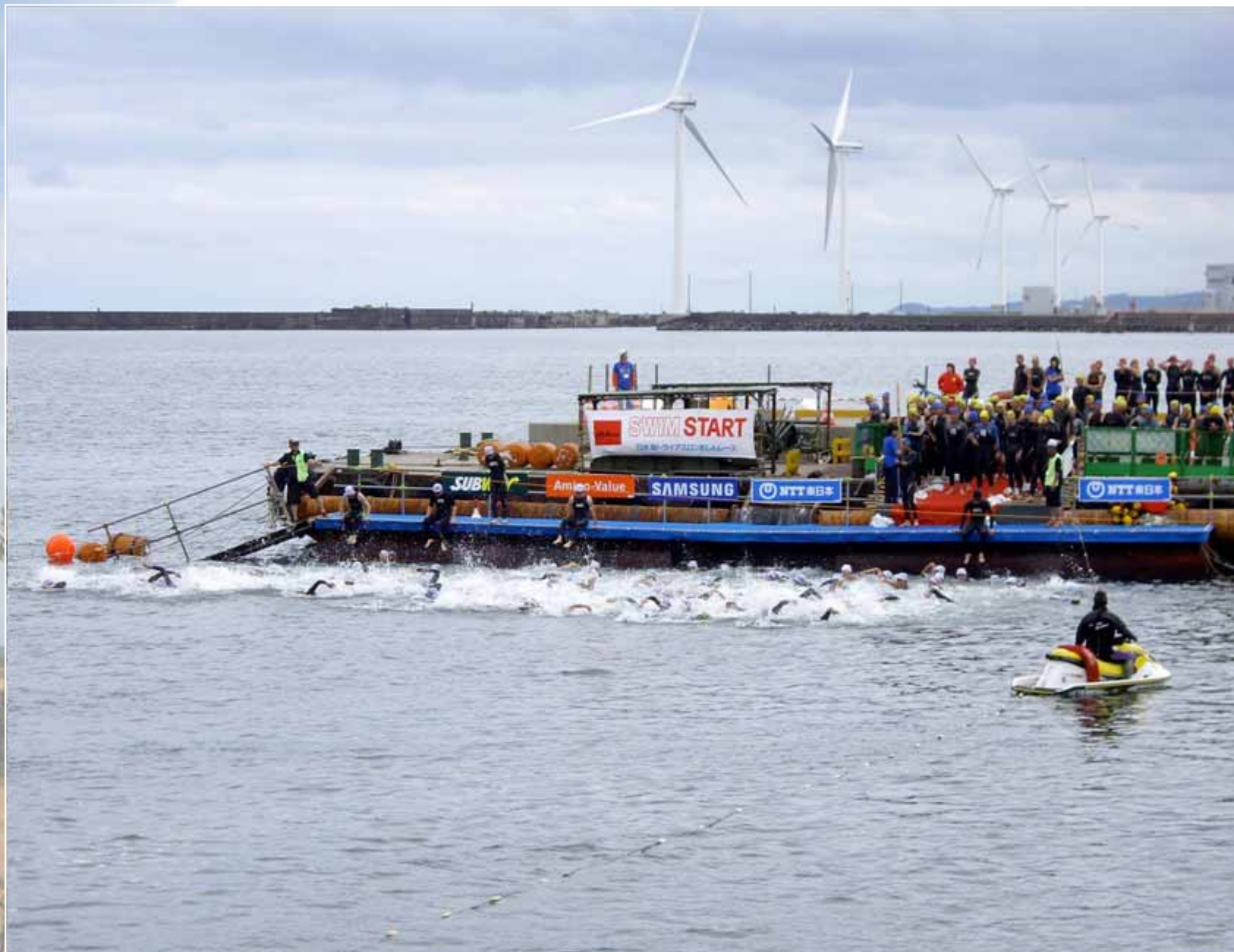
第23回日本海トライアスロンおしんレーススタート(08:30)。一般部門186名、リレー23チームが出場。この後、2分おきのウェーブスタートが3回行われた。