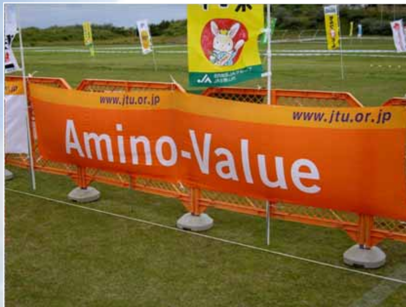
アドバナー(フィニッシュエリア付近掲出) :Amino-Value(協賛)