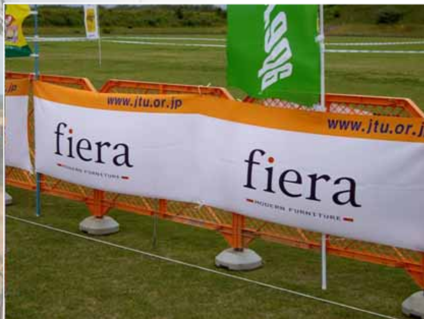
アドバナー(フィニッシュエリア付近掲出) :フィエラ(協賛)