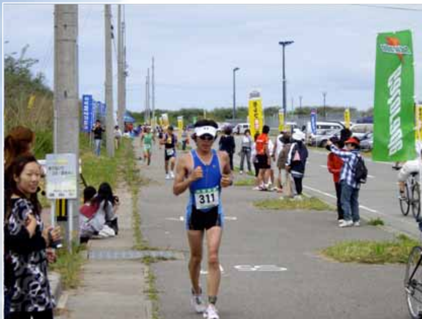
スタートから1時間30分が経過。出場者は次々とランへ入った