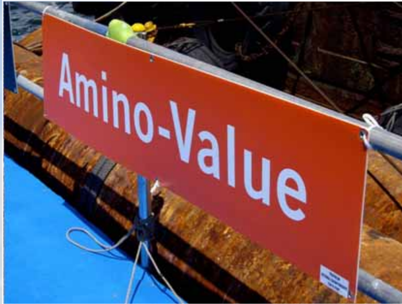
アドボード(スイムスタートエリア掲出) :Amino-Value(協賛)