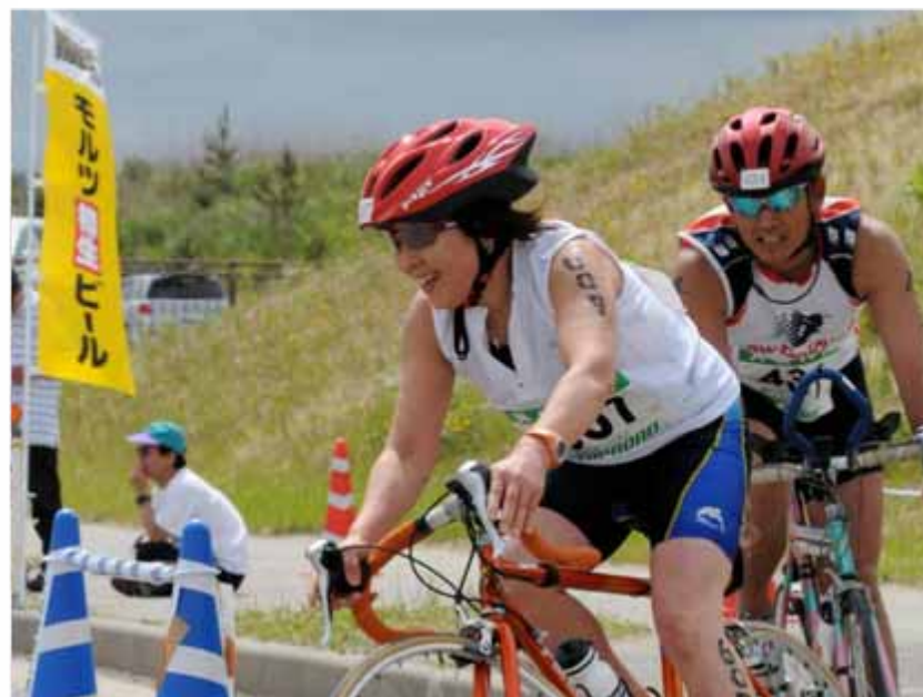
県内外からたくさんのトライアスリートが出場した