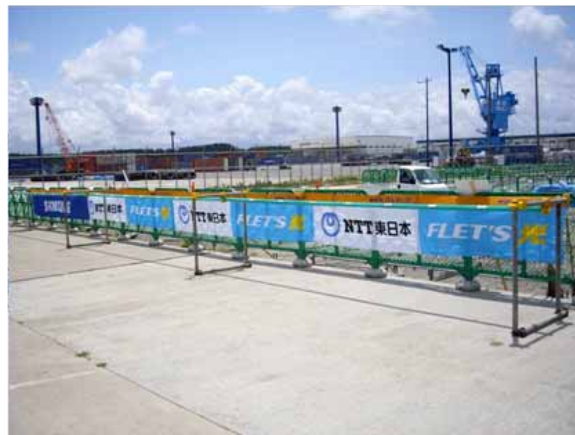
アドバナー(トランジションエリア付近掲出) :NTT東日本(協賛)