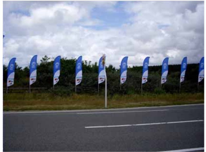
のぼり(コース沿道掲出):NTT東日本