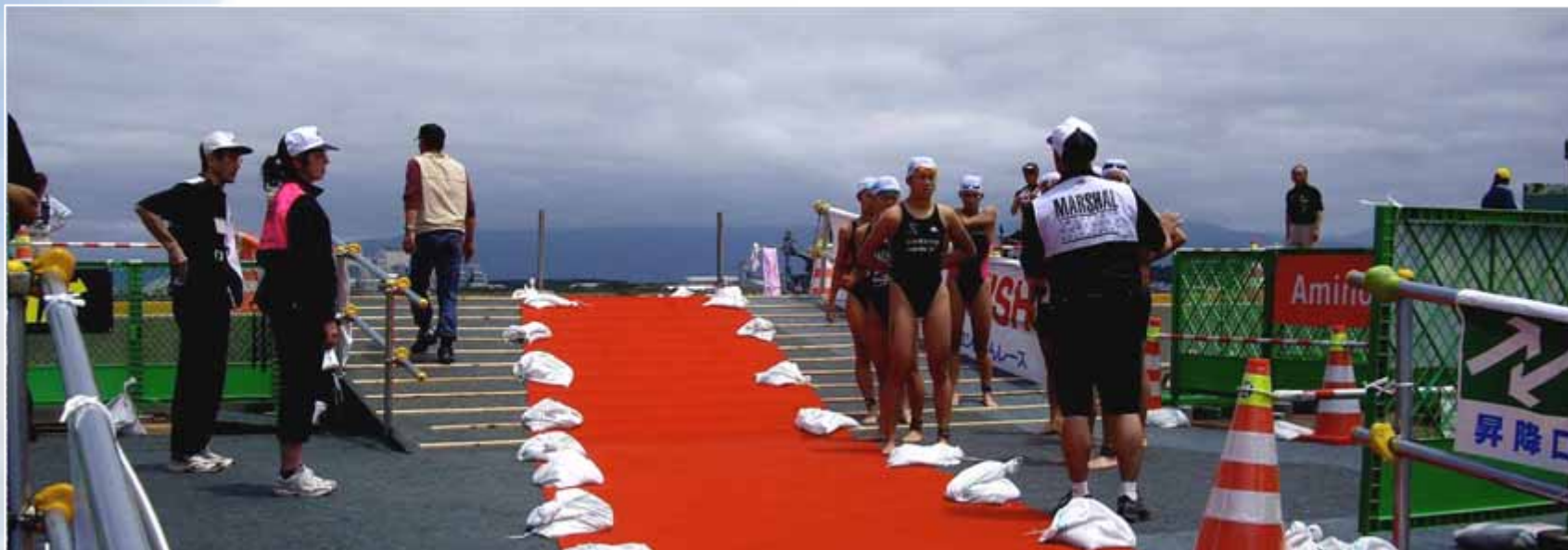
11時20分、スーパースプリント女子スタート。出場選手計7名。

このスーパースプリント дистанスは、総合距離51.5km(スイム1.5km/バイク40km/ラン10km)のオリンピック дистанスの4分の1の距離以下の競技を指します。酒田大会では、総合距離5.4km(スイム200m/バイク4km/ラン1.2km)を3ヒート行い、ヒートごとの順位をポイント化して、3レースの総合ポイントで総合順位を競います。トライアスロン大国といわれるオーストラリアではこの短距離型トライアスロンが盛んに開催されています。こうした短い距離は、スピードとテクニックを磨くには最適とされています。