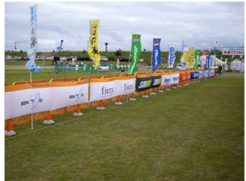
アドバナー(フィニッシュエリア付近掲出) :全体