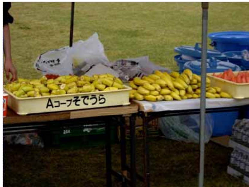
エイドステーション