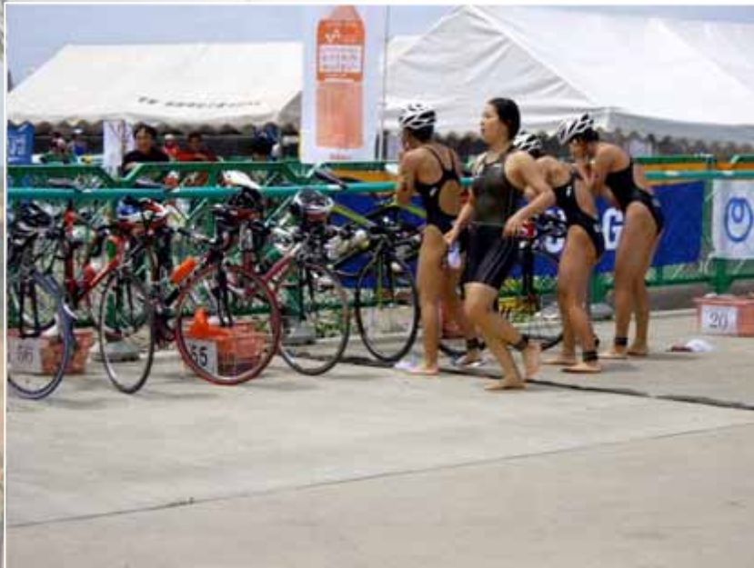
トランジションエリア(エリート/スーパースプリント)