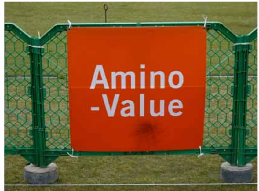
アドボード(940×985 / トランジションエリア付近掲出) : Amino-Value(協賛)