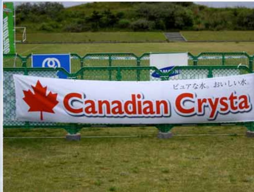
アドバナー(トランジションエリア付近掲出) :カナディアンクリスタ(協賛)