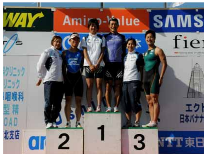
男女総合1~3位による記念撮影