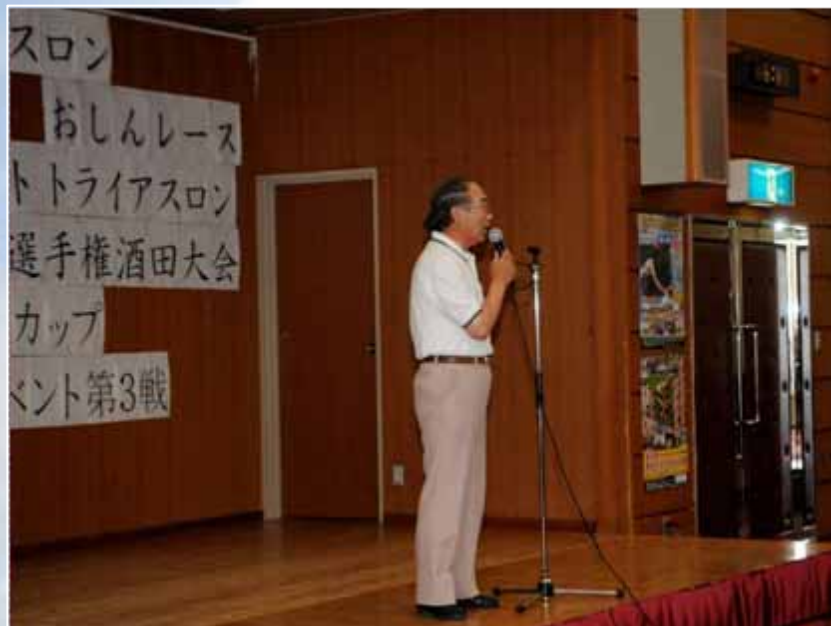
一般・リレー出場者競技説明会(18:30~/勤労福祉センター)