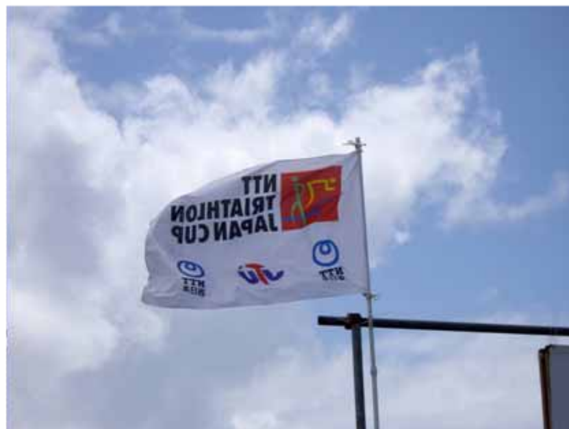
ジャパンカップシリーズ旗(フィニッシュゲート)