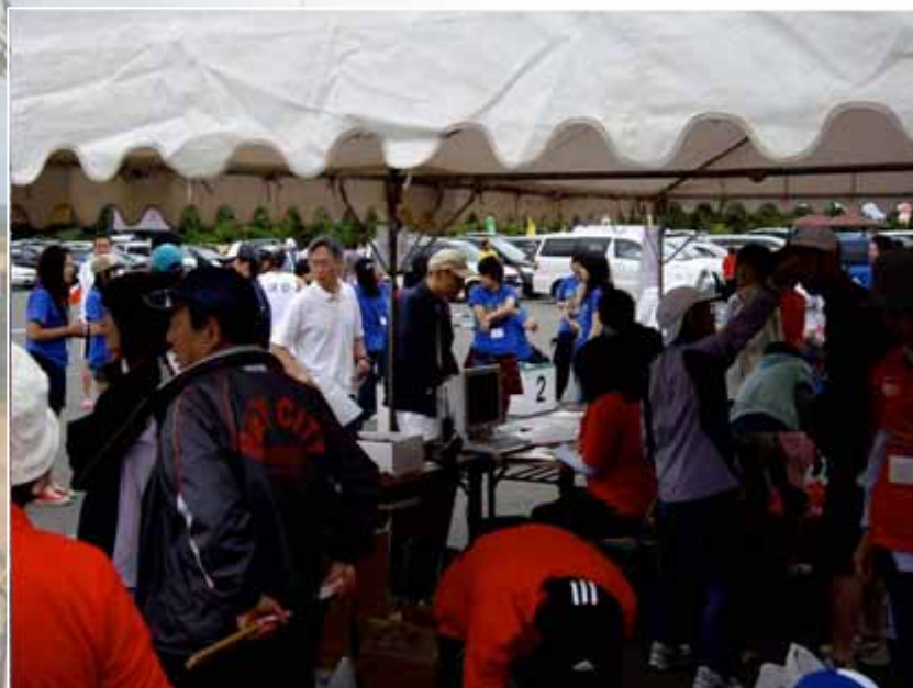
選手受付会場の様子