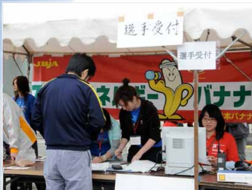
選手受付(06:00～ / 大会主会場)