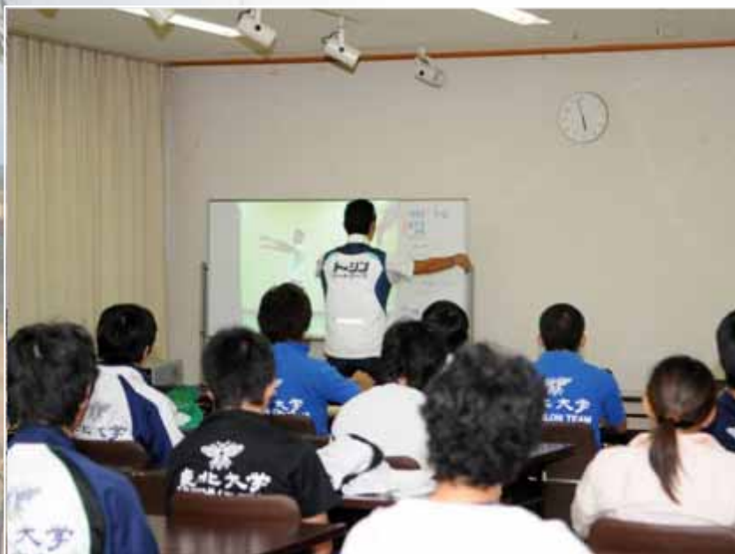
トライアスロンクリニック(17:30~/勤労福祉センター)