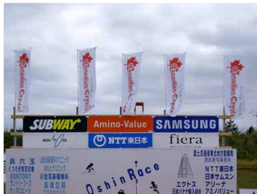
のぼり(表彰式会場掲出): カナディアンクリスタ