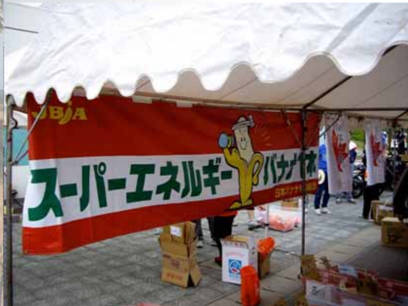
アドバナー(エイドステーション掲出):日本バナナ輸入組合