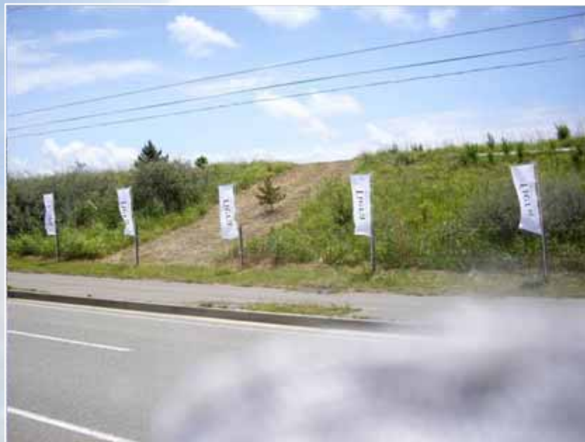
のぼり(コース沿道掲出): フィエラ