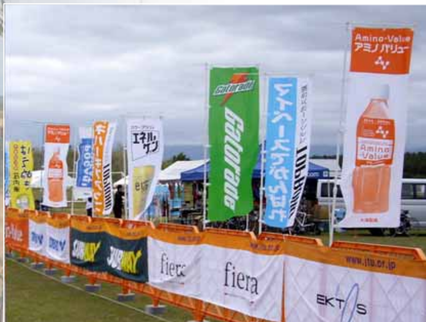
のぼり(フィニッシュエリア掲出): Amino-Value