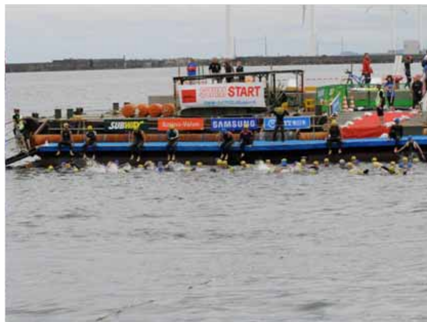
スタートの合図と同時に、出場者は次々と海へ