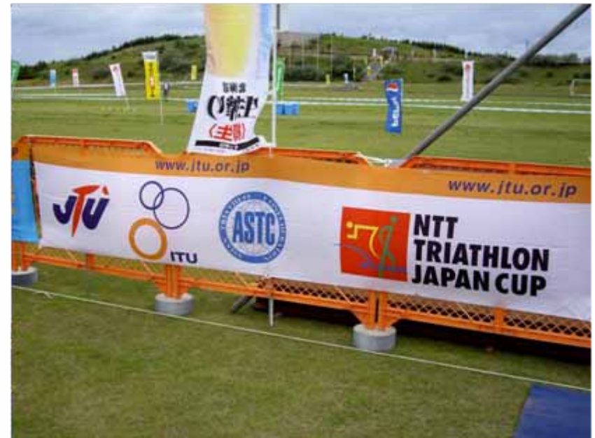
アドバナー(フィニッシュエリア付近掲出) :ジャパンカップシリーズ