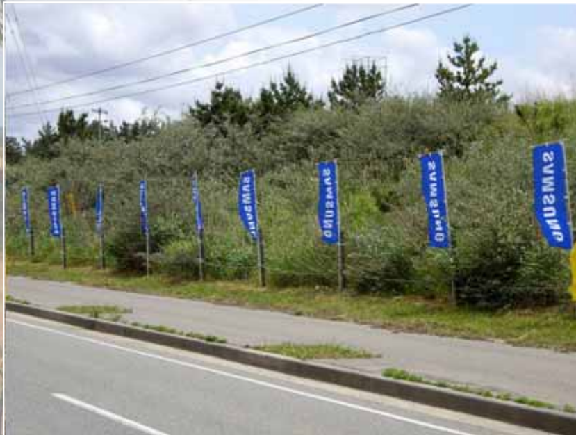
のぼり(コース沿道掲出):サムスン