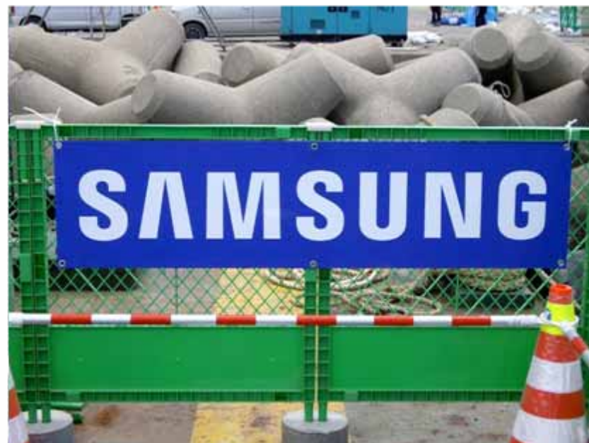
アドボード(スイムエリア掲出):サムスン(協賛)