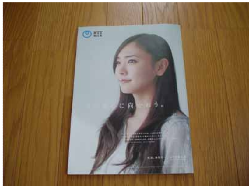
大会公式パンフレット(裏面)