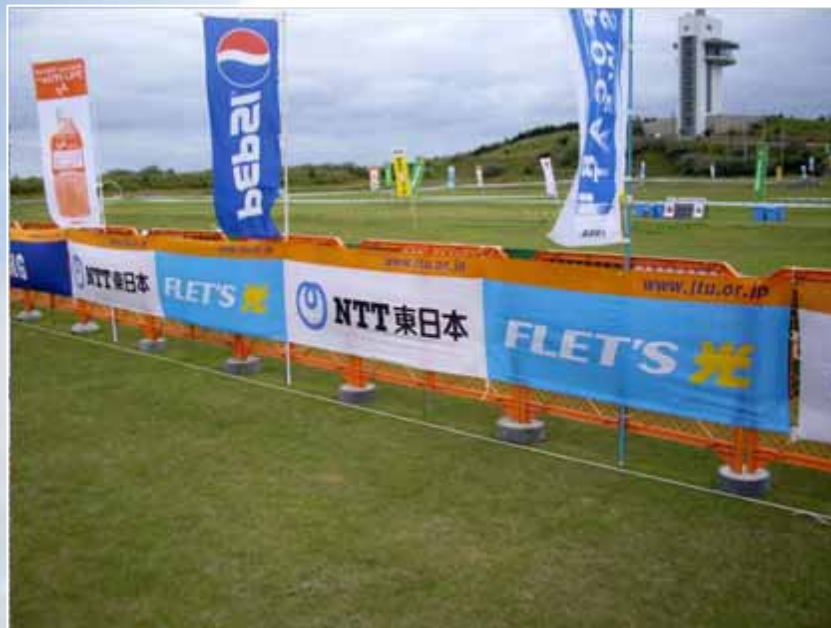
アドバナー(フィニッシュエリア付近掲出) :NTT東日本(協賛)