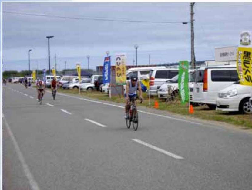
スイムを終え、北港海岸から湾岸道路へ