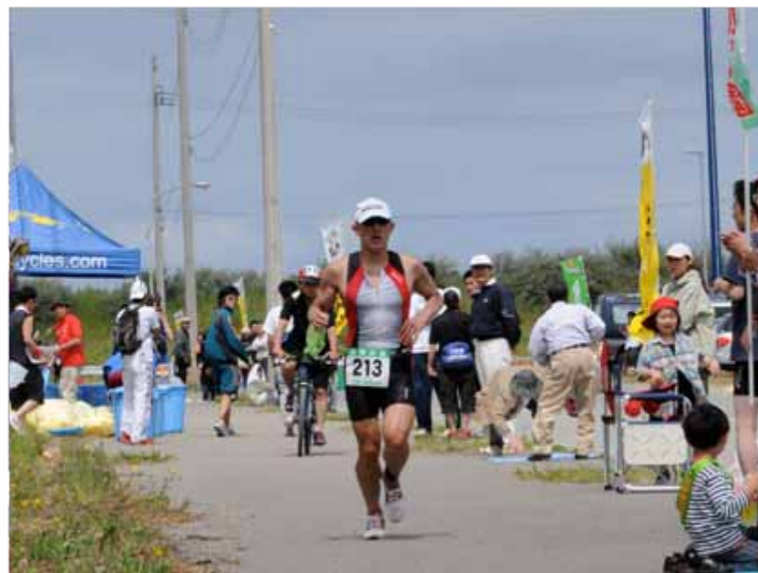
沿道は家族や仲間からの声援で賑わう