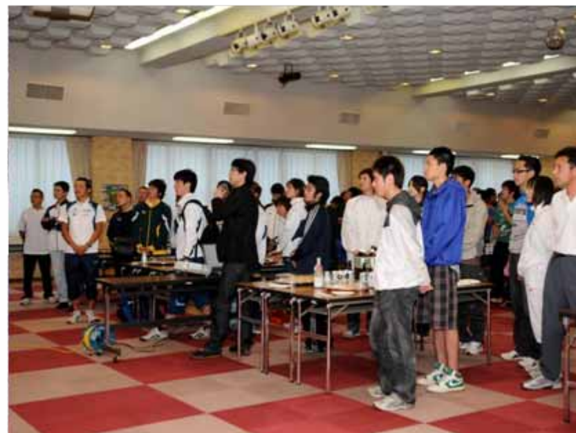
一般・リレー出場者競技説明会(18:30~/勤労福祉センター)