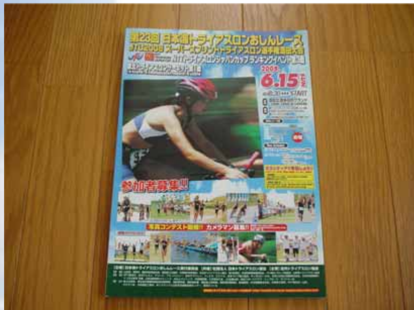
大会公式パンフレット(表紙)