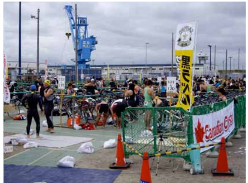
トランジションエリア(一般/おしんレース)