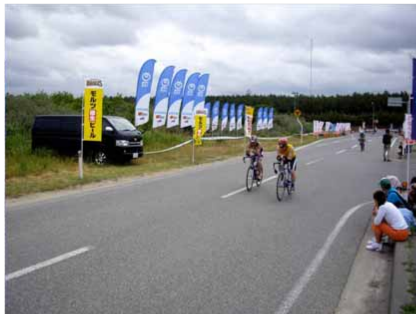
バイクは13.3kmのコースを3周回