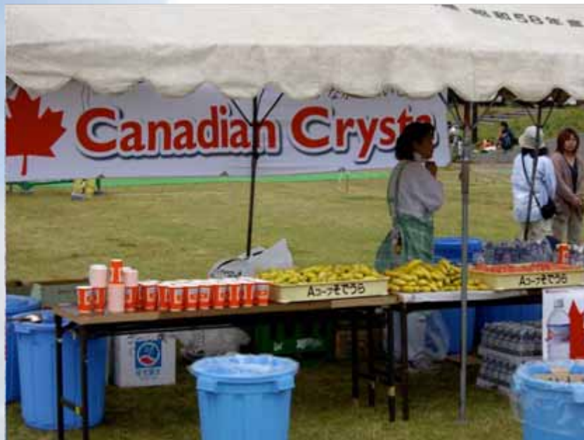
エイドステーション