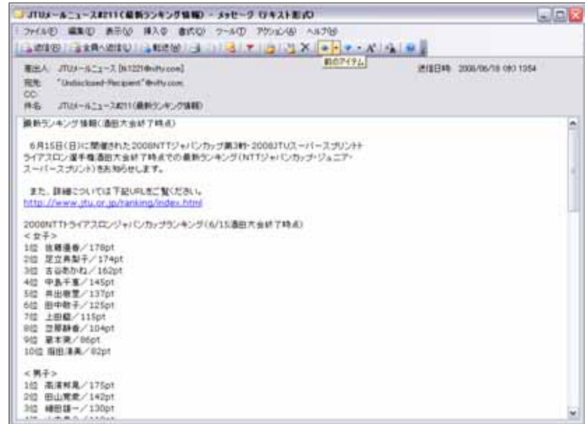
6月18日(水)配信「酒田大会終了時点最新ランキング情報」