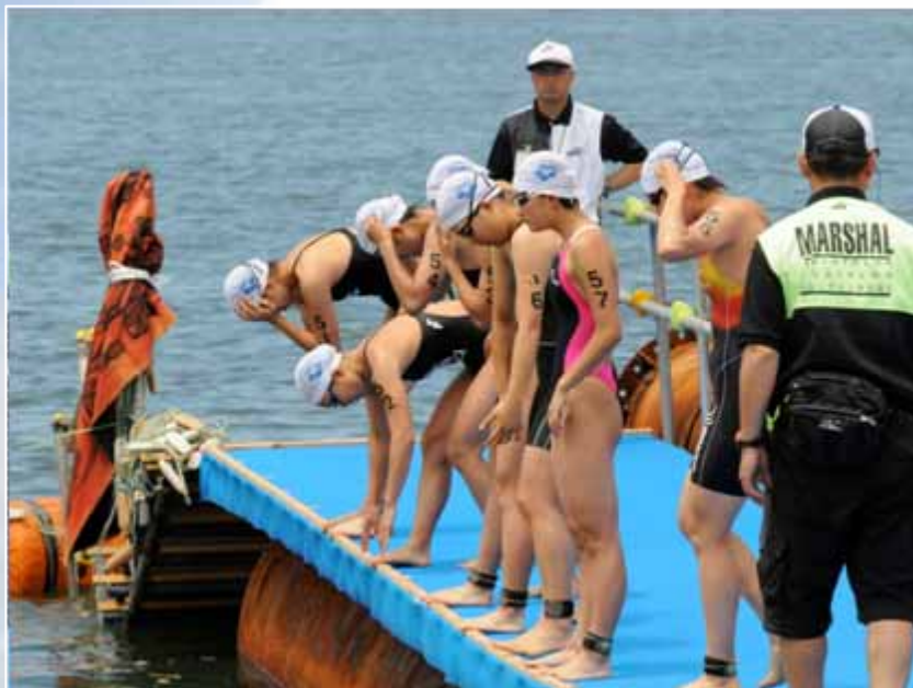
第1ヒート終了から約15分後、第2ヒートがスタートする