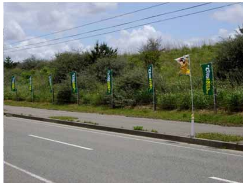
のぼり(コース沿道掲出): SUBWAY