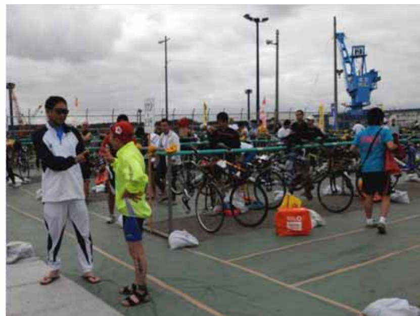
出場準備(一般・リレー出場者のトランジションエリアの様子)