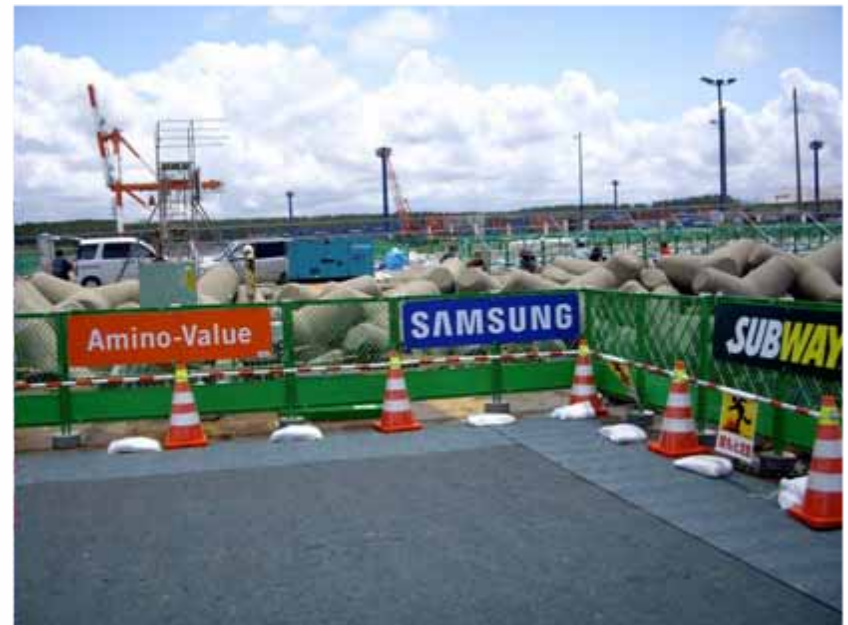
アドボード(スイムエリア掲出) :全体