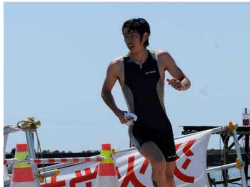
第1ヒートと同様、遠藤がスイム・バイクで先行する展開に