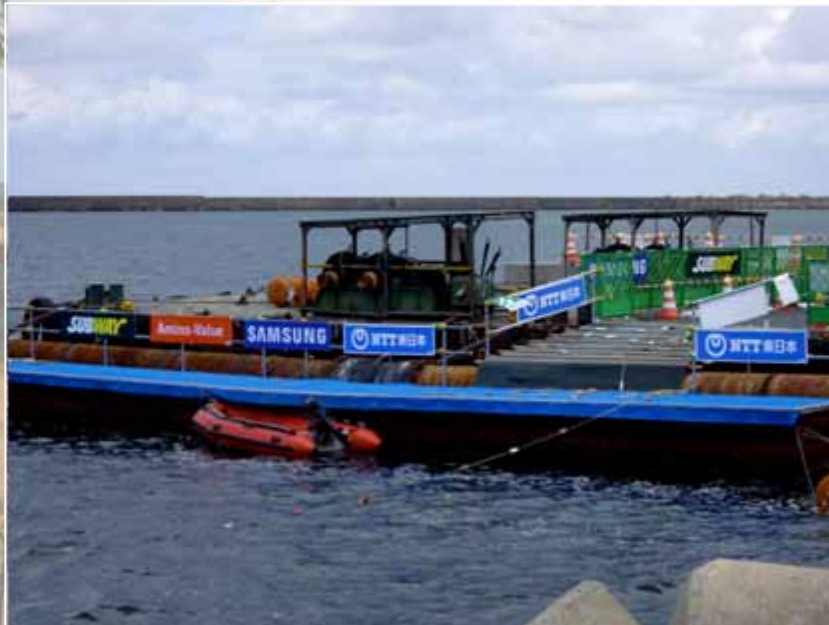
アドボード(スイムスタートエリア掲出) :全体