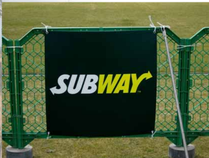
アドボード(940×985 / トランジションエリア付近掲出) : SUBWAY(協賛)