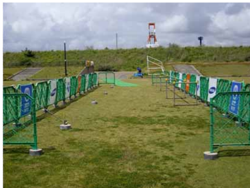
アドボード(940×985 / トランジションエリア付近掲出) : 全体