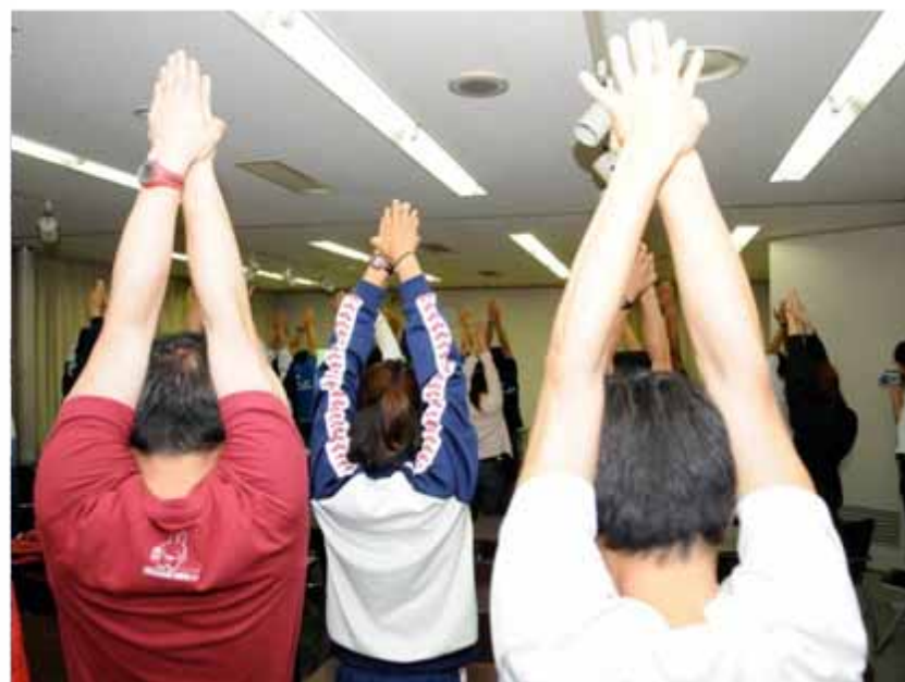
トライアスロンクリニック(17:30~/勤労福祉センター)