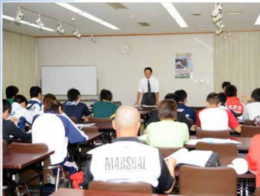
選手競技説明会(16:30~/勤労福祉センター)