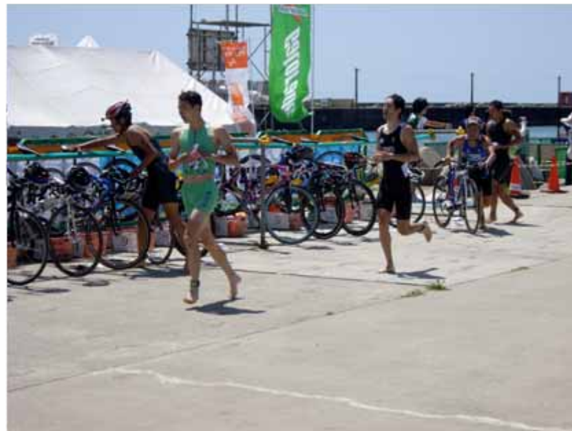
スタートから約3分。スイムを終え次々とバイクへ