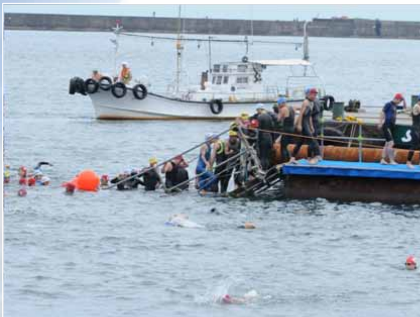
入水チェックを終え、スタート地点へ移動