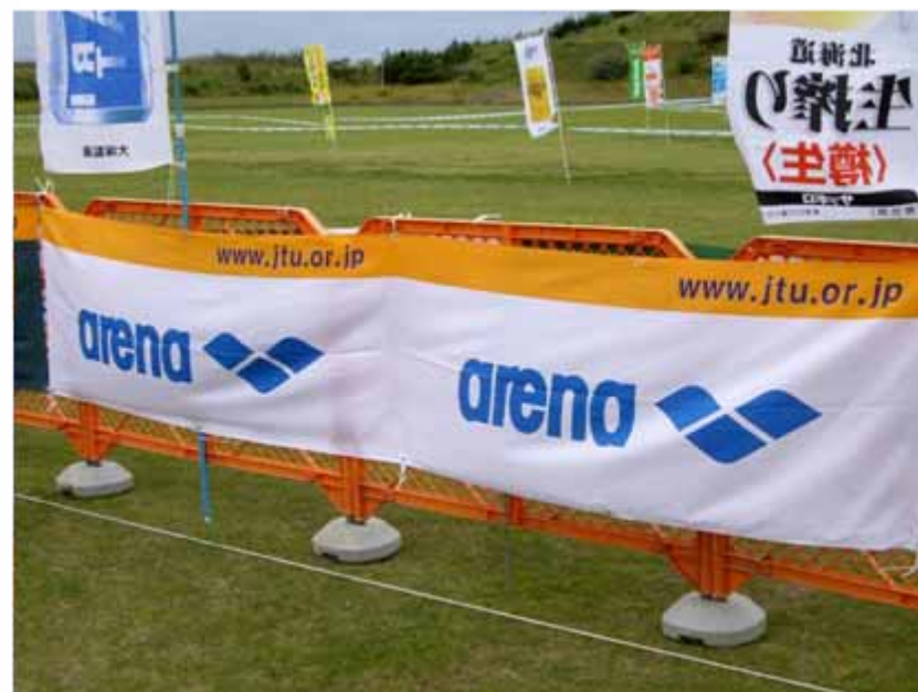
アドバナー(フィニッシュエリア付近掲出) :アリーナ(協賛)