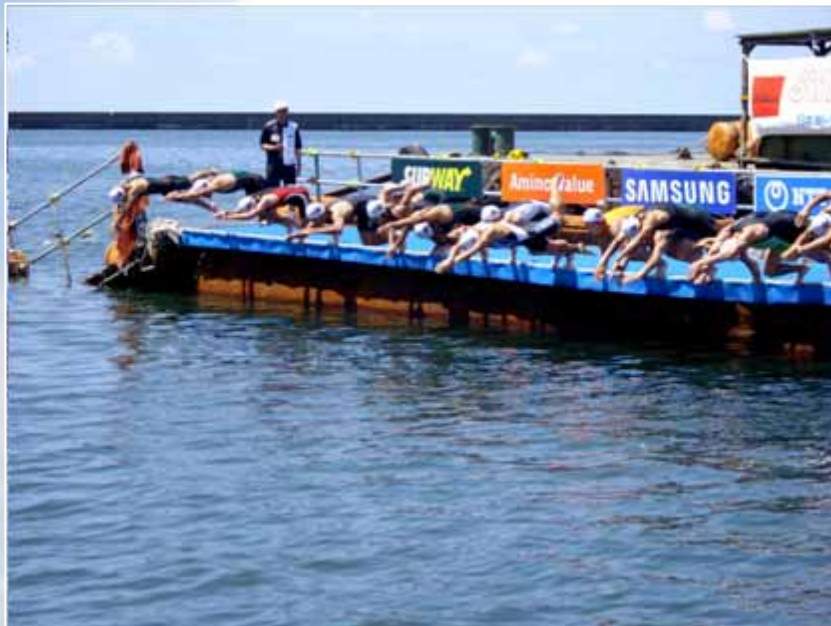
12時50分 男子第1ヒートスタート