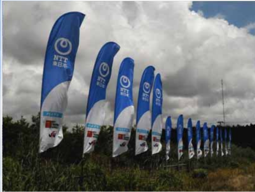
のぼり(コース沿道掲出):NTT東日本