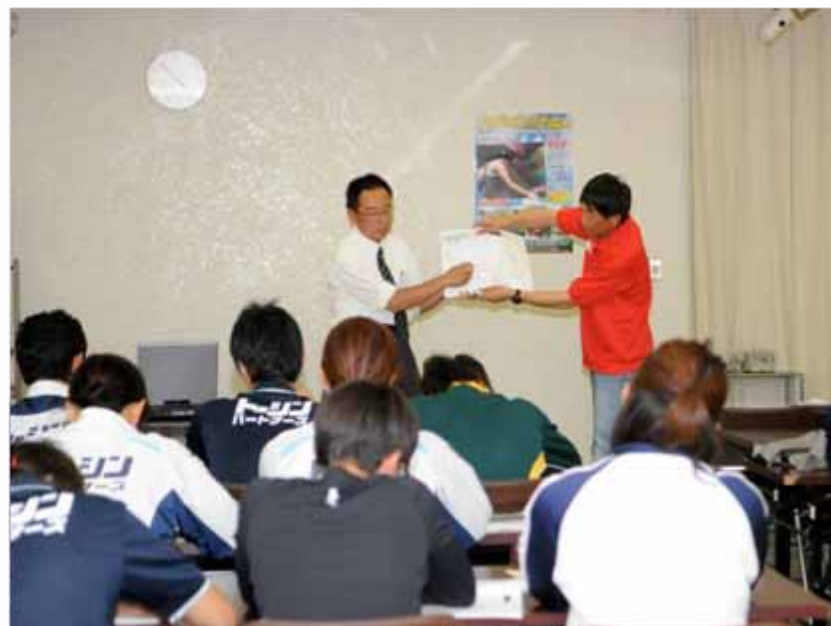
選手競技説明会(16:30~/勤労福祉センター)