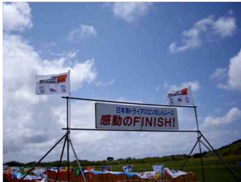
フィニッシュゲート