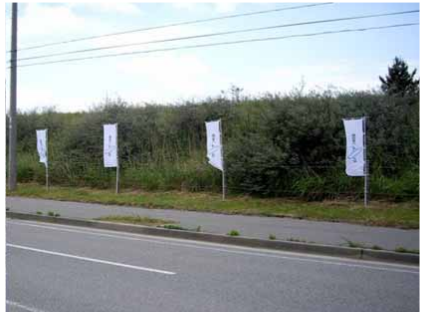
のぼり(コース沿道掲出):エクソス