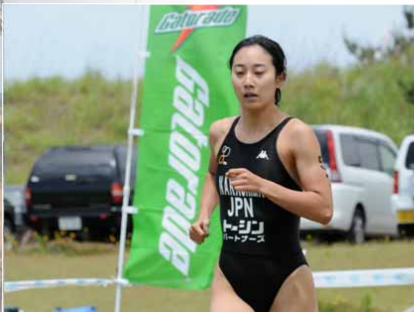
中島は序盤から積極的なレースを見せ、ランでも粘りを見せる