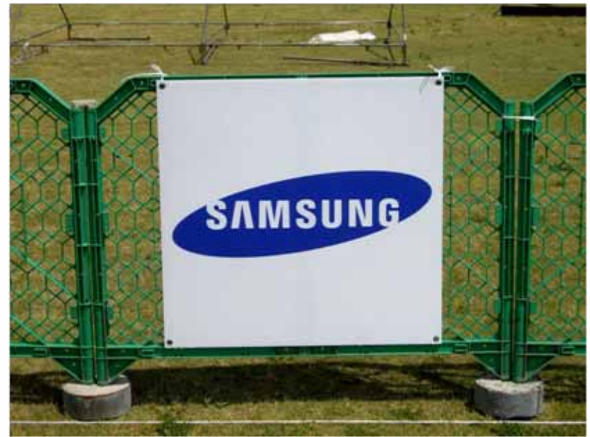
アドボード(940×985 / トランジションエリア付近掲出) : サムスン(協賛)