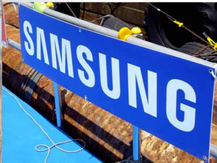
アドボード(スイムスタートエリア掲出):サムスン(協賛)