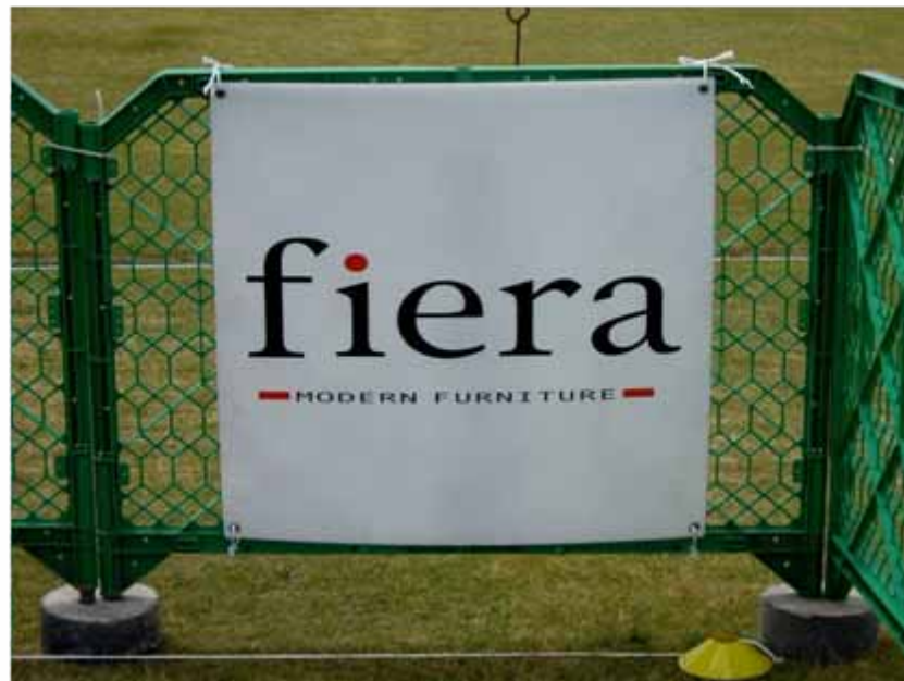
アドボード(940×985 / トランジションエリア付近掲出) : フィエラ(協賛)