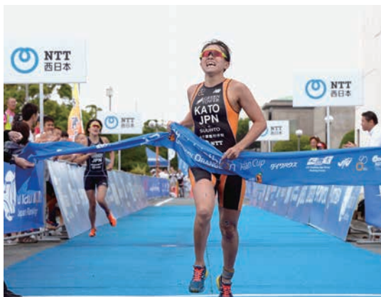
ITUトライアスロンアジアカップ蒲郡大会