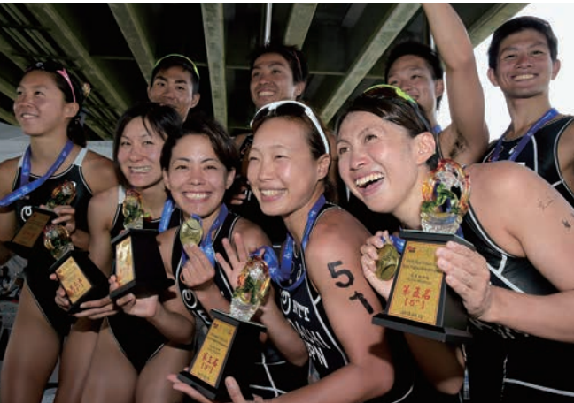
ASTCアジアトライアスロン選手権ニュータイペイ大会