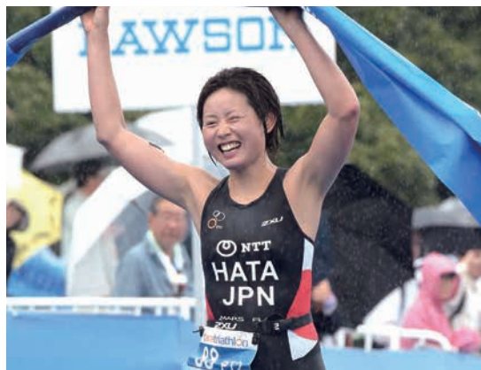
ITU世界トライアスロンシリーズ横浜大会