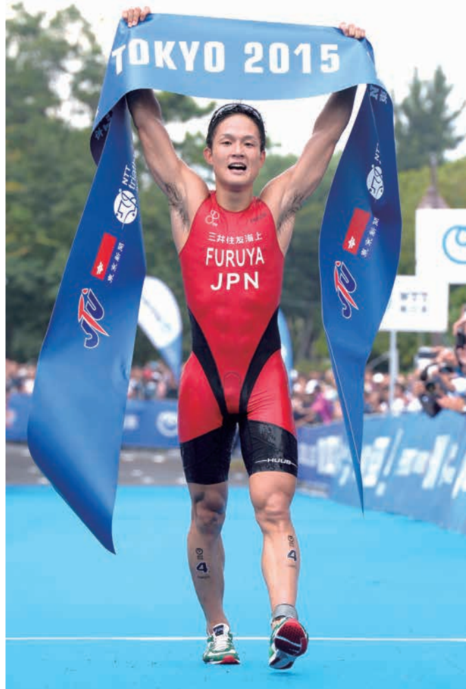
第21回日本トライアスロン選手権東京港大会