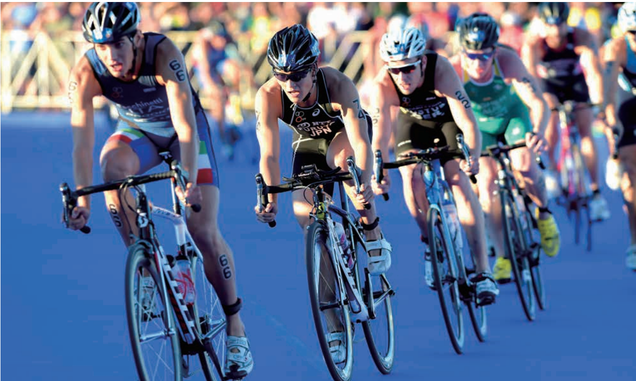
ITU世界トライアスロンシリーズグランドファイナルシカゴ大会