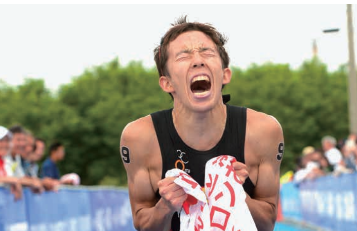
第5回日本U23トライアスロン選手権