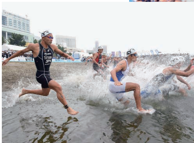
第21回日本トライアスロン選手権東京港大会