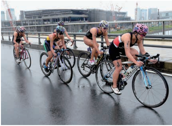
第21回日本トライアスロン選手権東京港大会