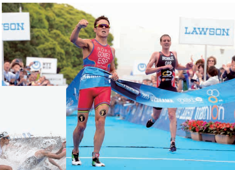
ITU世界トライアスロンシリーズ横浜大会