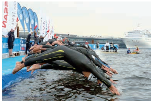
ITU世界トライアスロンシリーズ横浜大会