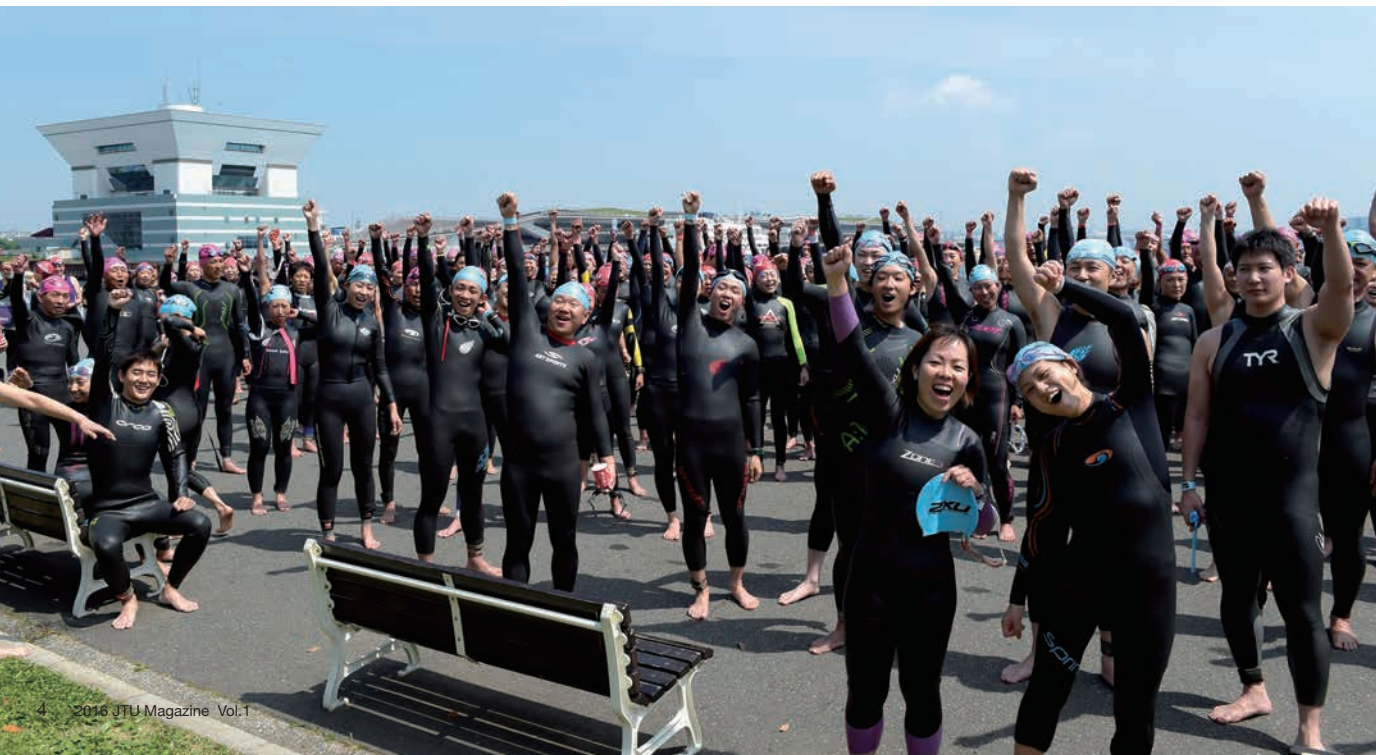
ITU世界トライアスロンシリーズ横浜大会