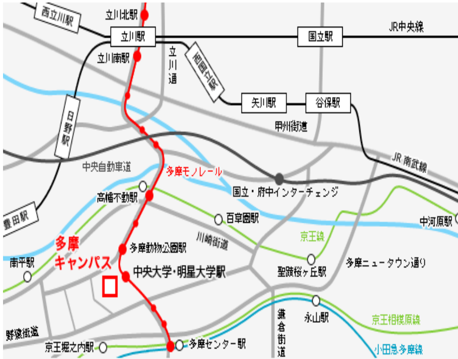
中央大学多摩キャンパス内 第2体育館室内プール (多摩モノレール「中央大学・明星大学駅」徒歩5分)