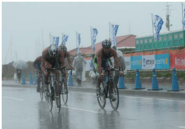
厳しいコンディションとなった男子第3ヒートのバイク