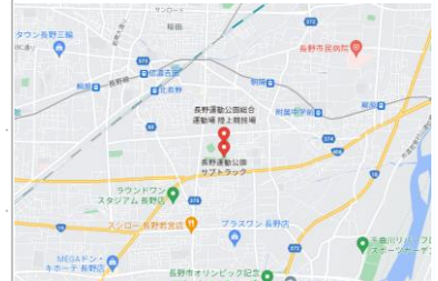
長野市東和田陸上競技場