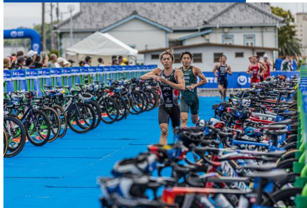
トランジションエリア(エリート)