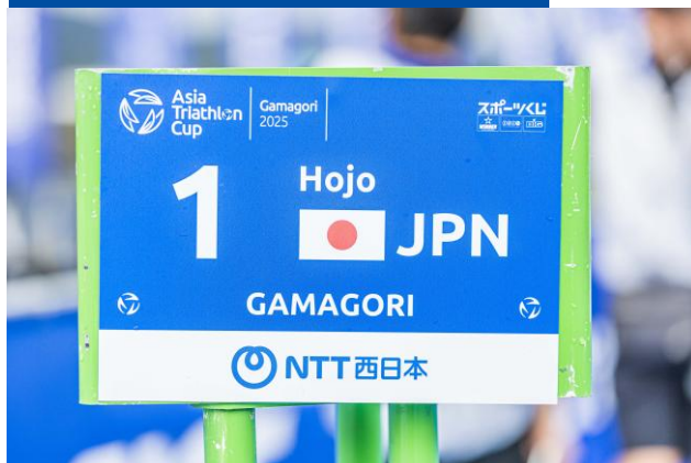
バイクラックナンバー