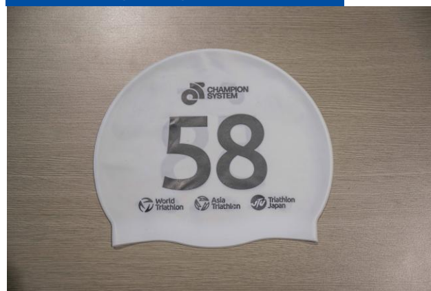
スイムキャップ(エリート)