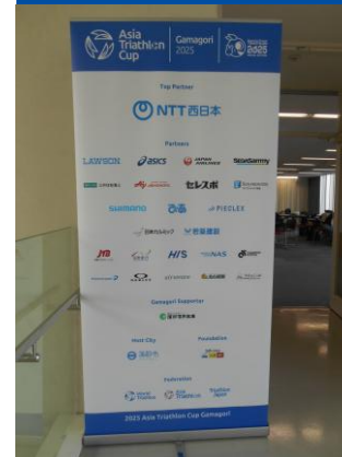
ロールアップバナー