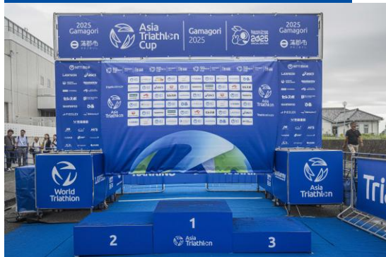
表彰バックボード