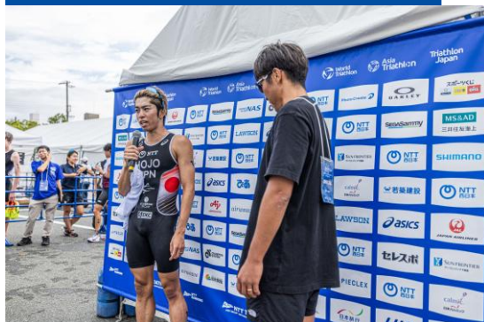
インタビューシート