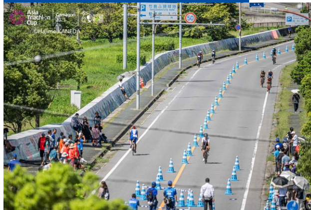
バイクコース(エイジ)