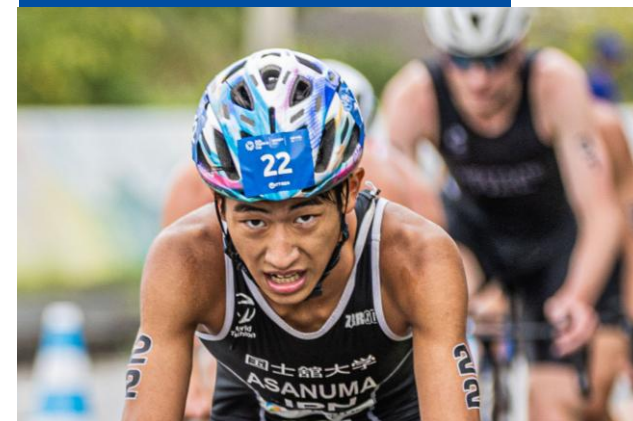
ヘルメットステッカー(エリート用)