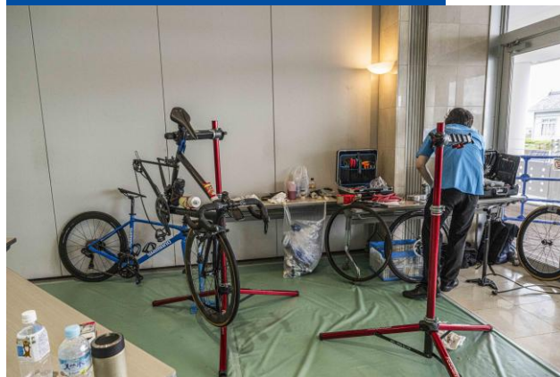
バイクメカニックサポート