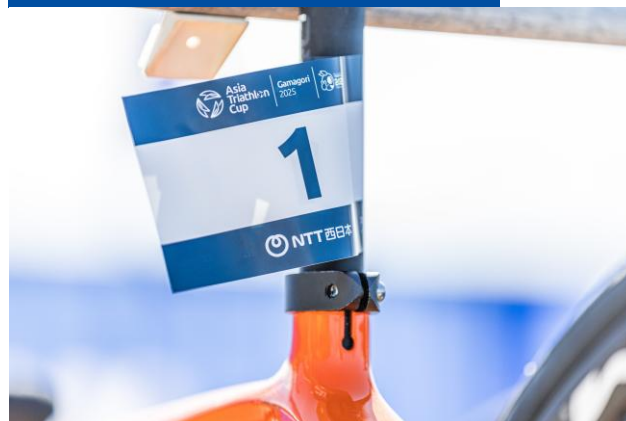
バイクステッカー(エリート用)