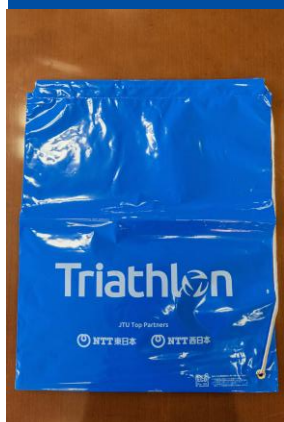
トランジションバッグ