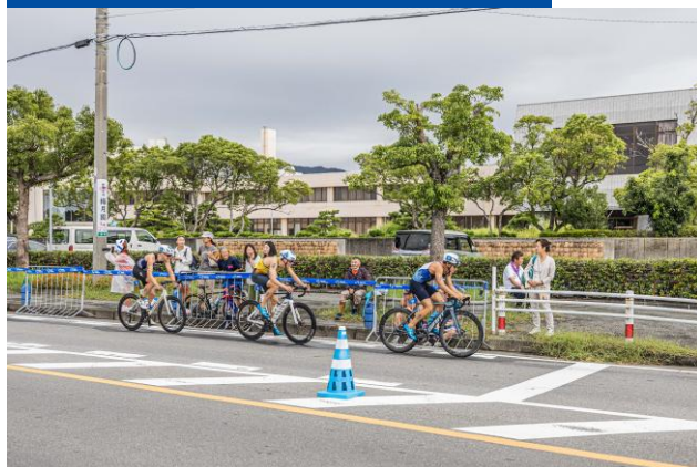
バイクコース(エリート)