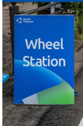
ホイールステーション