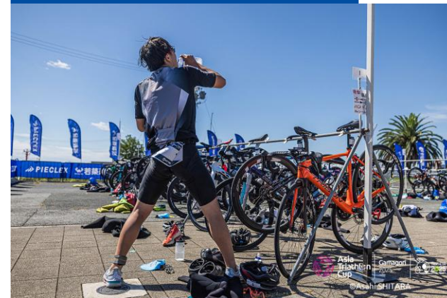
トランジションエリア(エイジ)