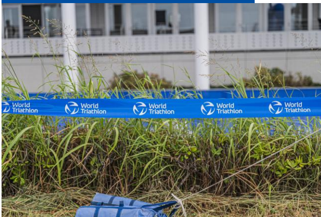
バリケードテープ