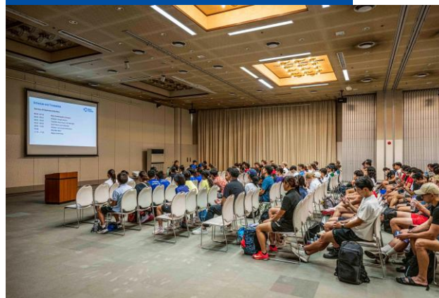
競技説明会(エリート)