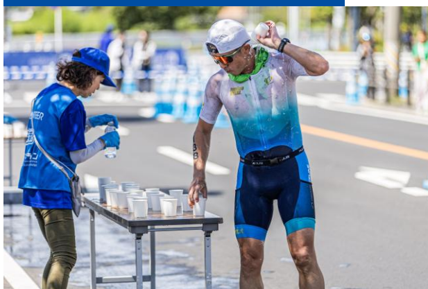
エイドステーション