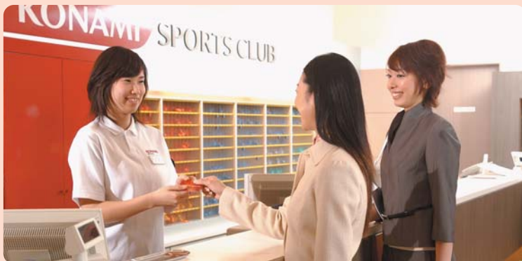
※2008年3月までにご入会手続きをされた方は、2008年4月以降、「2008年度JTU会員カード」をご提示いただく場合がございます。