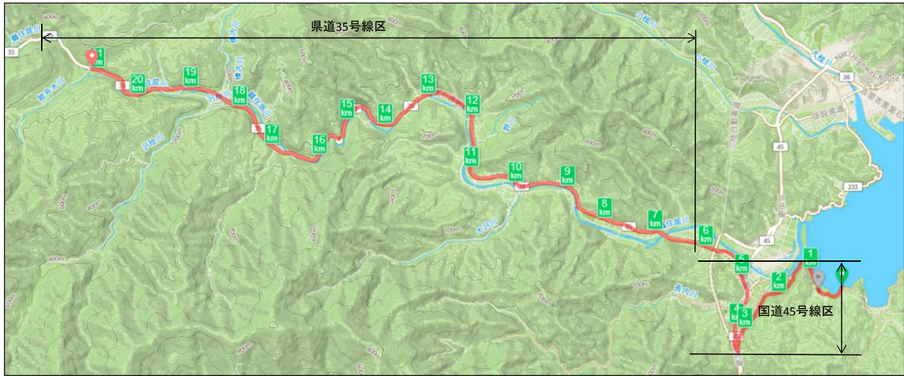
各ポイント到達バイク所要予想時間