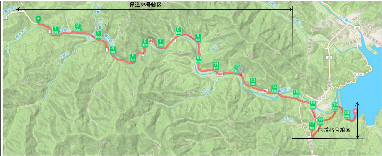
折返地点の標高 約230